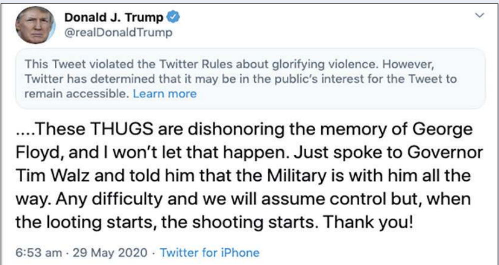
تغريدة ترامب التي وصفها «تويتر» بأنها تمجد العنف

وخلال توقيعه الأمر التنفيذي في البيت الأبيض، قال ترامب للصحافيين «نحن هنا للدفاع عن حرية التعبير من إحدى أكبر المخاطر التي واجهتها عبر التاريخ»، بالإشارة إلى ما يعتبره تحكّم الشركات التي تدير منصات التواصل الاجتماعي بالمحتوى المنشور فيها. وأضاف «تسيطر حفنة صغيرة من وسائل التواصل الاجتماعي الاحتكارية القوية على جزء كبير من التواصل العام والخاص في الولايات المتحدة وكانت لديهم سلطة غير مقيدة في الرقابة وتقييد وتعديل وتشكيل وإخفاء وتغيير أي شكل من أشكال التواصل بين المواطنين العاديين أو الجمهور العام الكبير»، مشدداً على أنه «لا يمكننا السماح بحدوث ذلك».