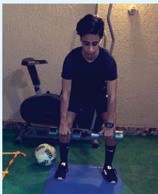
جديفة في التدريب بالمنزل