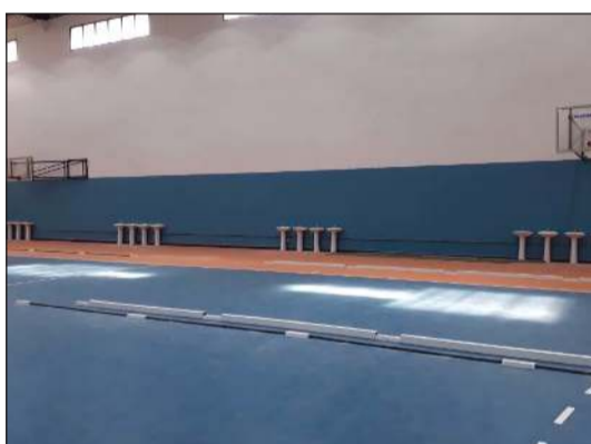
صالات نادي التضامن ستنتقل إلى مستشفى ميداني