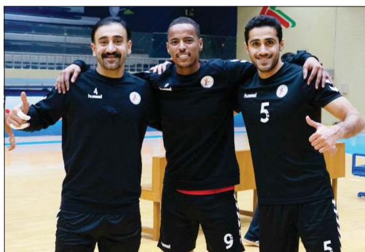
الأزرق عائد قريبا

تعتزم إدارة نادي التضامن مخاطبة الجهات المسؤولة عن النشاط الرياضي في البلاد لتأجيل استئناف المسابقات من جديد عقب ترحيل منافسات الموسم الحالي إلى منتصف سبتمبر المقبل في إطار جهود الدولة للحد من انتشار فيروس «كورونا» المستجد. ويأتي طلب إدارة «العنيد» بسبب تحويل منشآت النادي إلى مستشفى ميداني لعلاج ورعاية المصابين بالفيروس، الأمر الذي يعني صعوبة مباشرة تدريبات الفرق المختلفة قبل وقت كاف من الموعد المحدد في الأول من سبتمبر لاستئناف البطولات المحلية من جديد.