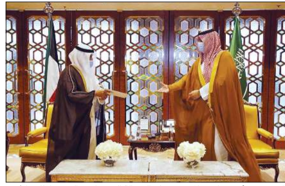
الشيخ د. أحمد ناصر المحمد يسلم الرسالة إلى صاحب السمو الملكي الأمير تركي بن محمد بن فهد

سموه خالص تهانيه بمناسبة العيد الوطني لبلاده، متمنياً له موفور الصحة والعافية، كما بعث سمو رئيس مجلس الوزراء الشيخ صباح الخالد ببرقية تهنئة مماثلة. من جانب أخرى، سلم مبعوث صاحب السمو الأمير الشيخ صباح الأحمد، وزير الخارجية الشيخ د. أحمد ناصر المحمد، رسالة خطية موجهة من سموه إلى أخيه خادم الحرمين الشريفين الملك سلمان بن عبدالعزيز آل سعود ملك المملكة العربية السعودية الشقيقة تتعلق بأوضاع العلاقات الأخوية المتينة التي تربط البلدين الشقيقين وآفاق تعزيزها وتطويرها في مختلف المجالات وعدد من القضايا ذات الاهتمام المشترك، وذلك خلال لقائه مع صاحب