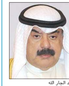
خالد الجار الله

تلقى نائب وزير الخارجية خالد الجار الله اتصالاً هاتفياً من وزيرة الدولة للشؤون الخارجية في جمهورية إثيوبيا الفيدرالية الديمقراطية تسونون تيلكر تم خلاله بحث مسألة ترحيل العمالة الإثيوبية المخالفة لقانون الإقامة في الكويت. وقالت وزارة الخارجية في بيان صحفي أمس الأربعاء إنه تم أيضاً خلال الاتصال استعراض عدد من أوجه العلاقات الثنائية بين البلدين وتطورات الأوضاع على الساحتين الإقليمية والدولية.