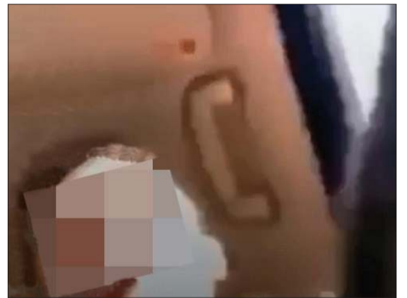
ضابط الدفاع، خلال المقطع داخل سيارته

وبين فتاة كانت محتبئة في المقعد الخلفي وهو يطلب منها الصمت لأنه سيتجاوز نقطة التفتيش حتى لا يسمعها رجال نقطة التفتيش. وقال المصدر: فور تداول المقطع صدرت التعليمات لرجال الجرائم الإلكترونية والذين تمكنوا من تحديد هوية الضابط وتوقيفه في مسكنه بمنطقة الدسة، حيث اعترف أنه قام بكسر الحظر وتمكين أخرى من ذلك. على صعيد آخر، جار ضبط