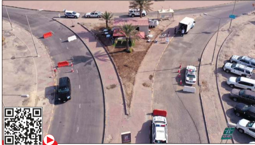
الانتشار الأمني كان لافتا منذ بدء الحظر