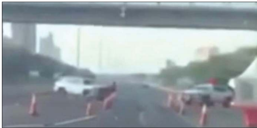
النقطة الأمنية التي تجاوزها الضابط