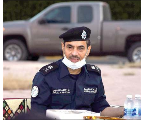
اللواء فراج الزعبي

ويستحوذ الأمن على ربيع البلاد، كما أكد على نهج الوزارة في تطبيق مبدأ الثواب والعقاب لمكافأة المجد والأخذ بيده لارتقاء بمستوى الأداء في مجمل الخدمات الأمنية، وكذلك الأخذ على يد المسيء حتى يكون عبرة لغيره لأن العمل الأمني من أهم أولوياته الانضباط والالتزام بالسلوك الحميد.