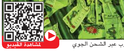
جانب من التباك المهرب عبر الشحن الجوي

القانونية بحق مستورد المواد المحظورة. يشار الى ان إدارة الصحة المهنية بوزارة الصحة وكذلك وزارة التجارة حظرتا استيراد وتداول هذه المادة. هذا وتحذر الادارة العامة للجمارك كل من تسول له نفسه تهريب المواد والبضائع المحظورة بكل أشكالها وأنواعها من التعرض للمسائلة القانونية واتخاذ الإجراءات الجمركية بحقه.