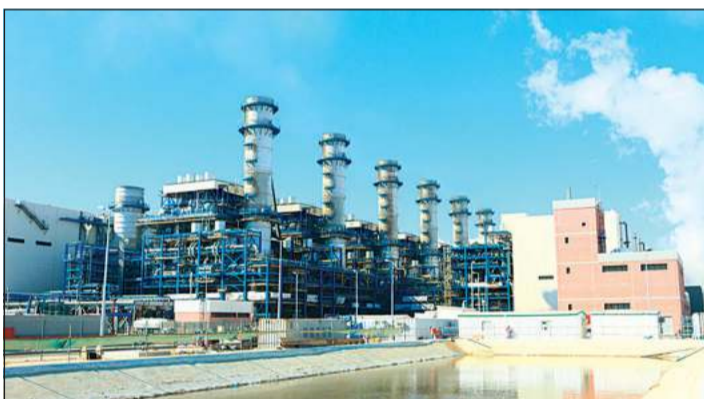
الأعمال في محطات توليد الطاقة الكهربائية لم تتوقف خلال الفترة الماضية

أما فيما يتعلق بسير العمل، فلفتت المصادر إلى أن الوزارة لم تتوقف عن أداء العمل سواء فيما يتعلق بالأمور الإدارية أو الفنية كونها وزارة خدمية وعليها الكثير من المسؤوليات والالتزامات، وبالتالي فإن العمل سيستمر في الإطار، ولكن وفق إجراءات وقواعد جديدة تؤمن أعلى قدر من الحفاظ على صحة الجميع. وذكرت المصادر أن الوزارة أهمية تولى كبيرة للخدمات الإلكترونية، مشيرة إلى أنها ستعتمد إلى توسعة وتفعيل العديد من الخدمات التي تقدمها الوزارة في دفع الفواتير وتلقي الشكاوى، كما أنها استحدثت أخيراً تقديم طلبات تمديد التيار، وهذا ما سيساهم في تسهيل العمل بشكل أفضل دون حاجة المراجعين للتواجد في الوزارة لإنهاء عملهم، ما يساعد في تطبيق خطة التباعد الاجتماعي.