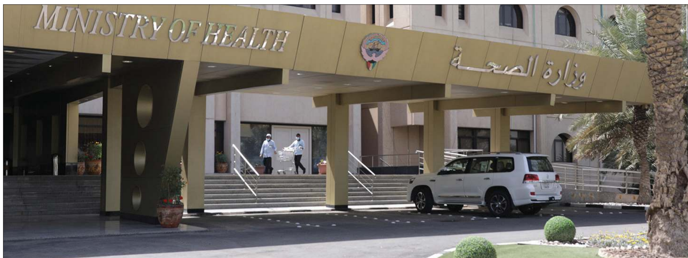
وزارة الصحة مستمرة بالعمل في مختلف مرافقها

الاستعانة بالإداريين والوظائف الأخرى وفق جدول محدد بالتناوب.. واستخدام التكنولوجيا لتحديد المواعيد وتسليم المعاملات