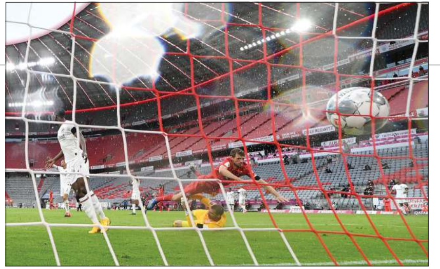
مولر مسجلا أحد أهداف بايرن ميونيخ