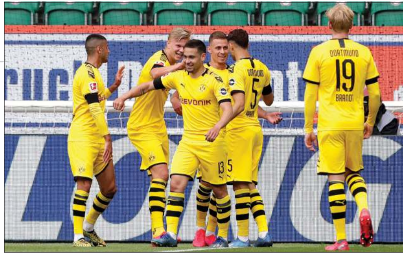
رافائيل جوريرو يحتفل بهدف بوروسيا دورتموند في فولفسبورغ

بات ملعب «سان سيرو» الشهير في مدينة ميلانو الإيطالية، مهددا بالهدم بعد أن وجدت هيئة التراث الإيطالية أنه لا يمكن حمايته لأسباب ثقافية أو تاريخية. ويتشارك نادي المدينة إنتر ميلان في استخدام ملعب «جوزيبي مياتزا» العريق الكائن في ضاحية غربي ميلانو، حيث تقام عليه مباريات الدوري الإيطالي لكرة القدم، عدا عن استضافة لقاءات القطبين في المسابقات الأوروبية. واعتبرت دائرة لومبارديا التابعة لوزارة التراث الثقافي في تقرير لها أن «العقار الذي يطلق عليه اسم ملعب جوزيبي مياتزا «سان سيرو، ليس له أهمية ثقافية لذا فهو مستبعد من أحكام الحماية». وكشفت قطبا المدينة في سبتمبر الماضي عن تصورها لبناء ملعب جديد في موقع سان سيرو يتسع لنحو 60 ألف متفرج، وانقسمت الآراء لدى مسؤولي السلطات المحلية، حول المشروع بين المضي في بناء ملعب جديد، أو تجديد الملعب التاريخي وتم طلب رأي السلطات التراثية في البلاد. ووجد التقرير أنه مع خضوع الملعب لتعديلات مستمرة منذ بنائه في عام 1926، وبقاء جزء صغير فقط من الملعب الأصلي، فإنه لن يخضع للحماية. وعلى الرغم من أن موافقة الهيئة التراثية الإيطالية ليست القرار النهائي، إلا أنها قد تكون خطوة مهمة نحو أمل الفريقين في إعادة تطوير الموقع.