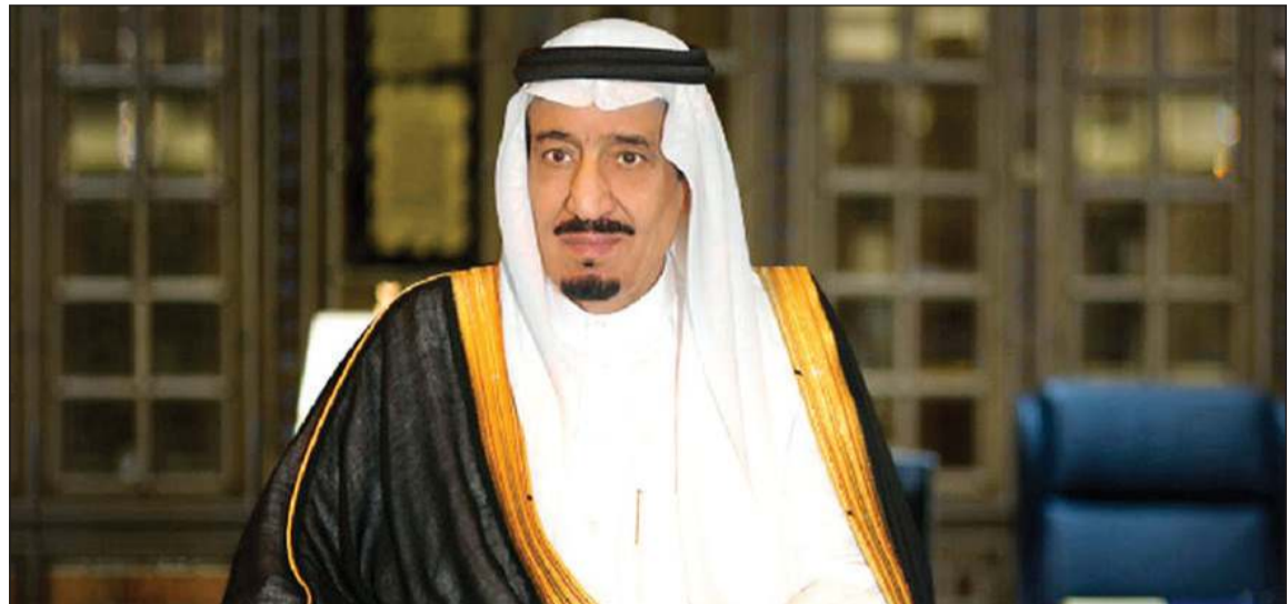
خادم الحرمين الشريفين الملك سلمان بن عبدالعزيز

وكالات: أعلن الرئيس العام لشؤون المسجد الحرام والمسجد النبوي عبدالرحمن السديس، عن صدور الموافقة الكريمة من خادم الحرمين الشريفين الملك سلمان بن عبدالعزيز، على إقامة صلاة عيد الفطر في الحرمين الشريفين، مع إيقاف حضور المصلين. وأكد السديس أن هذا القرار يدل على حرص خادم الحرمين الشريفين على إحياء هذه الشعيرة العظيمة في نفوس المسلمين في ظل هذه الجائحة التي أمت بالعالم أجمع.