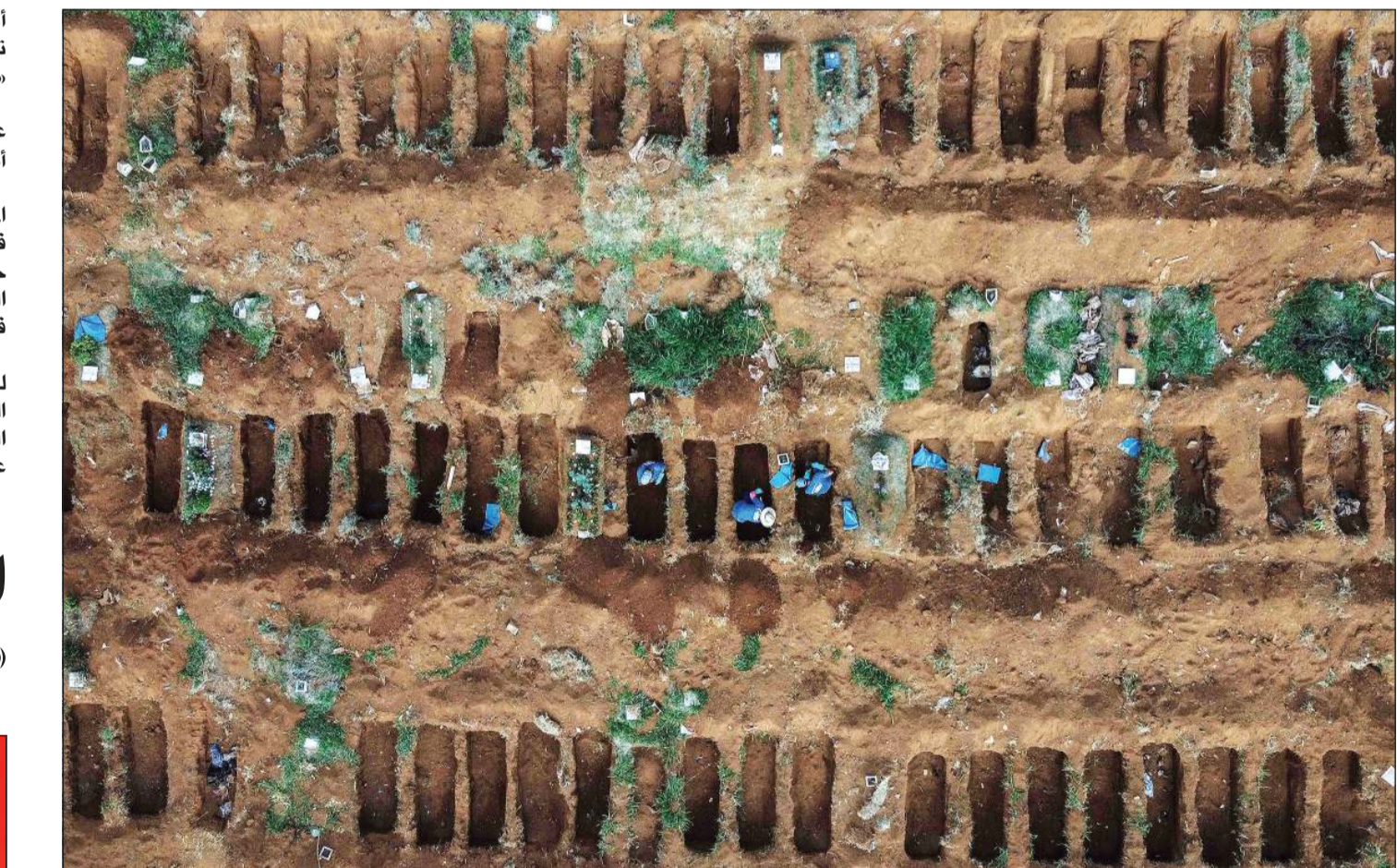
صورة جوية لعمال يدفنون قبوراً بالجملة لضحايا فيروس كورونا في ضواحي ساوباولو بالبرازيل

السود كيف يجب أن يفكروا ناهيك عن التصويت». وأضافت: «أشعر بأن أي شخص أسود مازال سيصوت لهذا الرجل ليس لديه مفهوم عن مارتن لوثر كينغ، أمل أن تكون هذه دعوة للاستيقاظ للأميركيين السود من أن الديموقراطيين وأمثالهم يرون أنكم أصواتنا مضمونة ولا شيء آخر». من جهته، وصف السيناتور الجمهوري عن ولاية كارولينا الجنوبية تيم سكوت التصريحات بأنها «التعليقات الأكثر انحطاطاً وغرسة تجاه المجتمع الأسود». وقال مغني الراب وكاتب الأغاني شون كومبس الملقب «ديدي»، لبايدن إن «التصويت الأسود ليس مجاناً». من جهته، أعرب جو بايدن عن أسفه لتعليقاته، وقال: «ما كان ينبغي أن أكون متعظراً إلى هذا الحد» وفقاً لفوكس نيوز، مؤكداً أنه يفهم أن التعليقات بدت وكأنه يأخذ التصويت الأسود «أمرًا مفروغاً منه»، لكنه أصر على أن الأمر ليس كذلك.