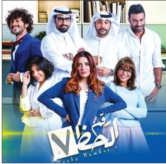
الجميع حضر وغابت الكوميديا