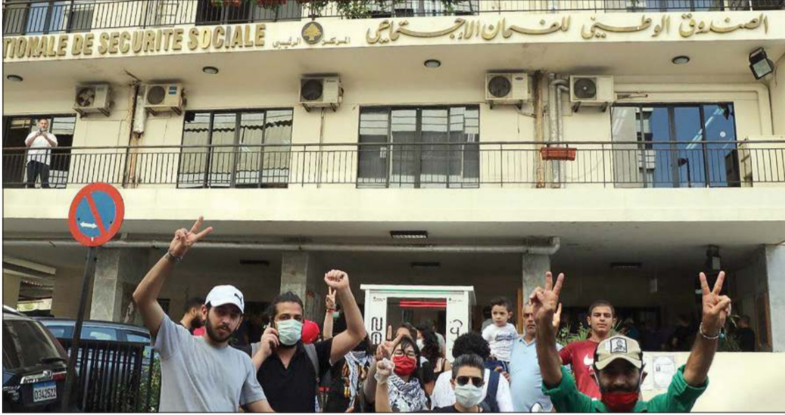
عدد من المتظاهرين خلال اعتصام في مبنى الضمان الاجتماعي في بيروت احتجاجاً على عدم اعطاء الموافقات المسبقة للدخول الى المستشفيات (محمود الطويل)

و دعا بري إلى «إعادة إنتاج الحياة السياسية انطلاقاً من قانون انتخابي جديد خارج النظام الطائفي ولبنان دائرة انتخابية واحدة»، مندداً على استقلالية القضاء، وطالب «الجميع موالاة ومعارضة» إلى استحضار كل القيم التي صنعت التحرير من أجل إنجاز