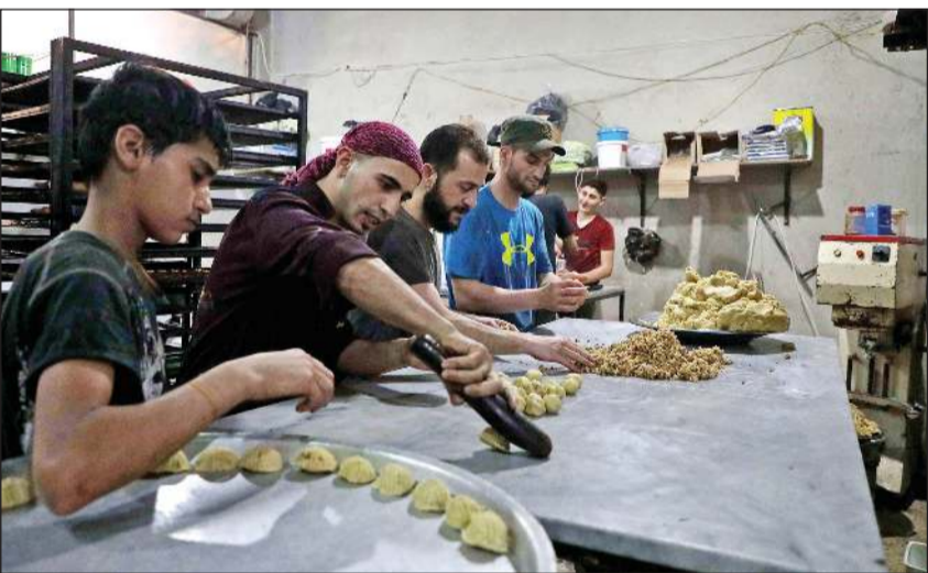
سوريون يحضرون حلويات العيد في مخبز يديره نازحون في بلدة الدانة بريف ادلب

عواصم - وكالات: قال المبعوث الأميركي الخاص للشؤون الإيرانية بريان هوك، إن لدى طهران الآن دوافع كثيرة للانسحاب من سورية، يقف على رأسها تفشي فيروس كورونا الذي «دمر» إيران. وأضاف هوك في مقابلة مع مجلة «فورين بوليسي»: «نعتقد إدارة ترامب أن لدى إيران حوافز متزايدة حالياً للانسحاب من الحملة العسكرية في سورية والتي تقدر كلفتها بمليارات الدولارات، حيث دمر تفشي الوباء البلاد، وأكد أن الولايات المتحدة «رصدت نزوحاً تكتيكياً للقوات الإيرانية من سورية». وتابع أن حماس طهران للحرب بالوكالة عبر الشرق الأوسط ربما يكون انخفض مؤخرًا، خاصة مع وفاة أكثر من 7 آلاف شخص في إيران بفيروس كورونا، وهو الرقم الذي يعتقد مسؤولون أميركيون أنه قد يكون أعلى بكثير. ميدانينا، شهدت بلدة البصيرة بريف دير الزور الشرقي، وقوع انفجارين خلفا ضحايا مدنيين، تزامنا مع إجراء التحالف الدولي عملية إنزال جوي في بلدة الشحيل. وقالت صفحة «نهر مدينا» أمنية في الشحيل، في ظل