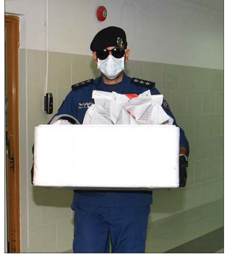
جولة «الإطفاء» لتوزيع الادوية