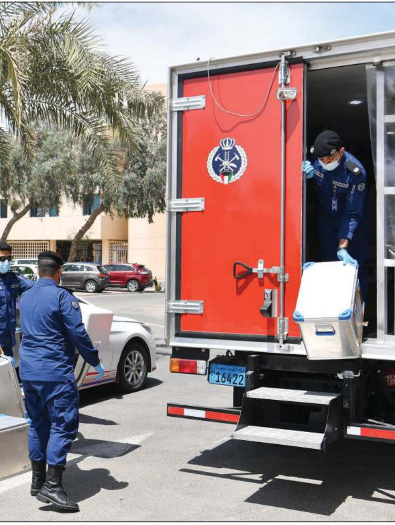
جهود حثيثة لخدمة المواطنين