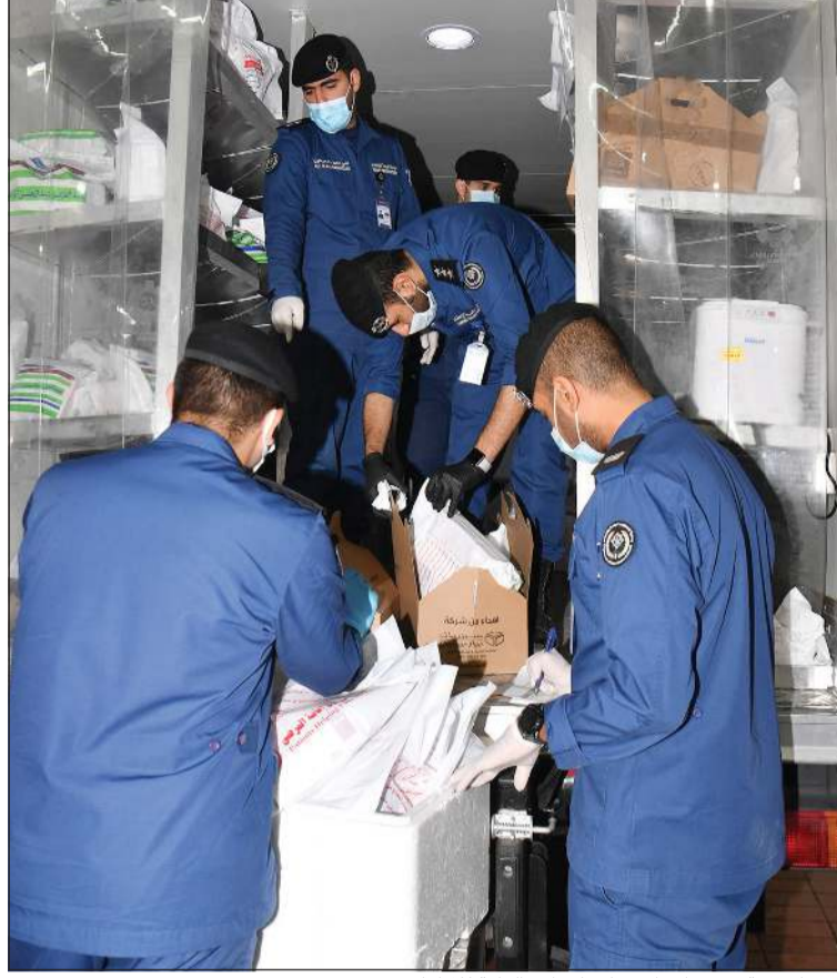
قرن الادوية في مركز الاسناد بالادارة العامة للإطفاء