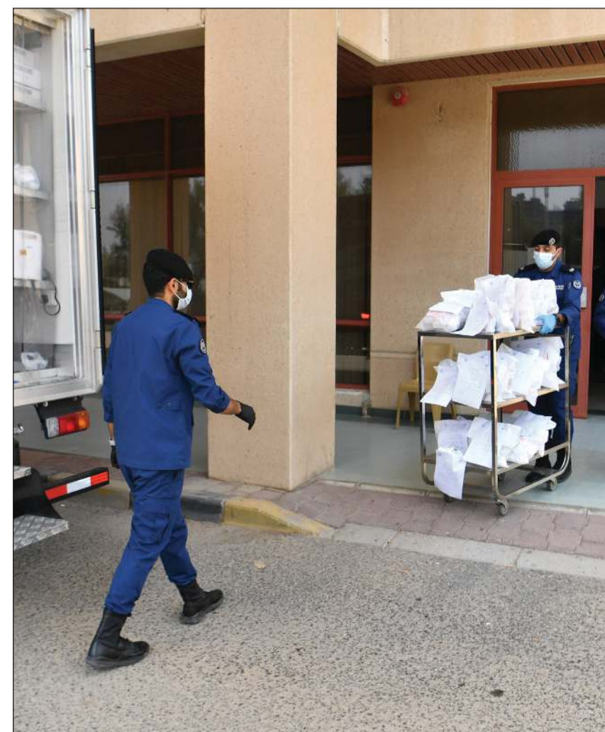
نقل الادوية من المستشفى إلى السيارات