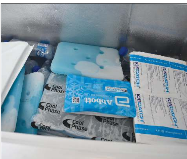
حفظ الادوية في درجة حرارة معينة