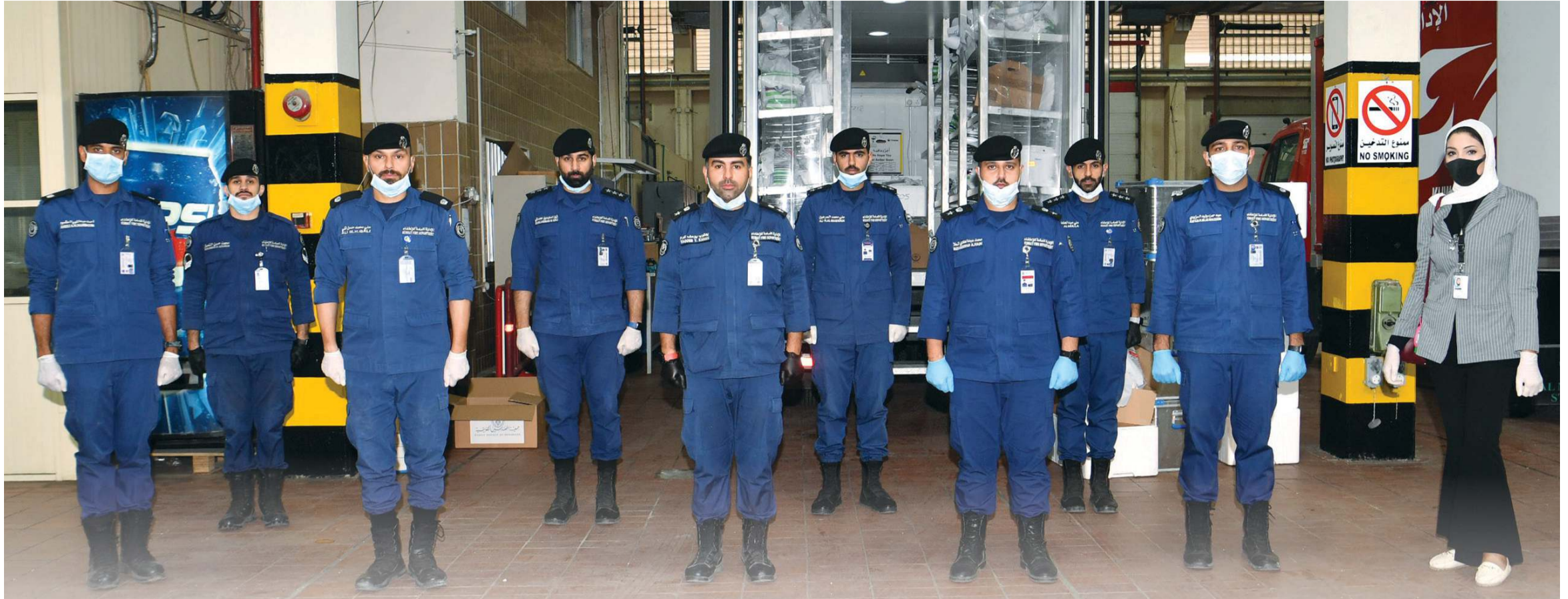
«الأنباء» رافقت فريقاً من الإدارة في جولة خاصة لتوزيع الأدوية على المرضى في منازلهم