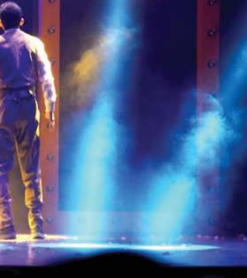
المخرج محمد الحملي