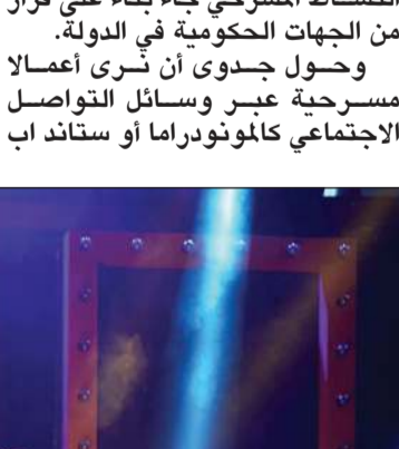
الفنان والمخرج علي الحسيني