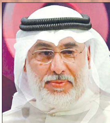
المخرج عبدالله عبدالرسول

مسرحية في العيد ولديها موظفون الضرر الذي سيقع عليهم سيكون أقل كونهم يتحملون اجباراً ورواتب موظفيها. أما الذين لديهم مسارح فهؤلاء مشكلتهم أكبر. والفنانون الموجودون في الكويت ويمتلكون مبانى «مسارح» تترتب عليهم إيجارات عالية وعدد موظفيهم أكبر وبالنسبة لهم إشغال المبنى ضروري حتى يتمكنوا من تسديد كافة التزاماتهم.