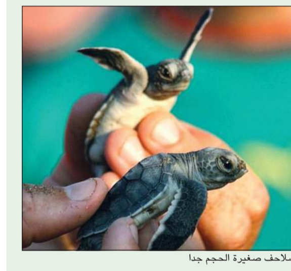
سلاحف صغيرة الحجم جدا