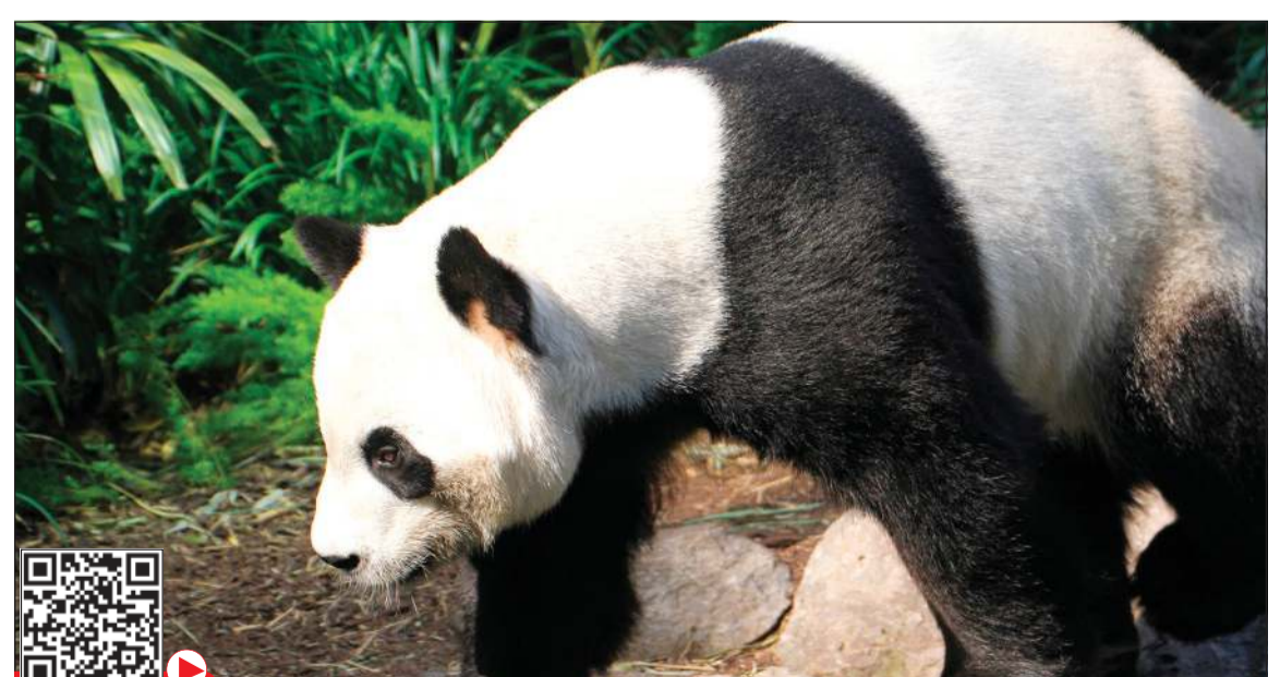
الباندا «إير شون» تعيش في كندا منذ 2013

أوتساوا - (أ.ف.ب): تقوم حديقة حيوان كندية بإعادة اثنين من دببة الباندا إلى الصين بعدما صعبت جائحة كورونا مسألة الحصول على مخزونات ضخمة من الخيزران اللازمة لإطعام هذه المخلوقات العملاقة. وتعيش «إير شون» وشريكها «دا ماو» في البلاد منذ العام 2013 كجزء من اتفاق إغارة مدته 10 سنوات مع منشأة لتربية الباندا في تشنغدو. وقد شكل وصول الحيوانين اللطيفين حدثا ضخما بث مباشرة على كل شبكات التلفزيون الكندية الرئيسية. وفي وقت لاحق، وضعت «إير شون» صغيرين وهما أول دبي باندا يولدان على الأراضي الكندية. لكن حديقة حيوانات كالغاري قالت إنها ستقتصر مدة إقامة الزوجين لأن تفنسي «كوفيد-19» عطل وسائل النقل وجعل من الصعب توريد 40 كيلوغراما من الخيزران الذي عادة ما تاكله الباندا البالغة كل يوم. وأوضحته الحديقة في