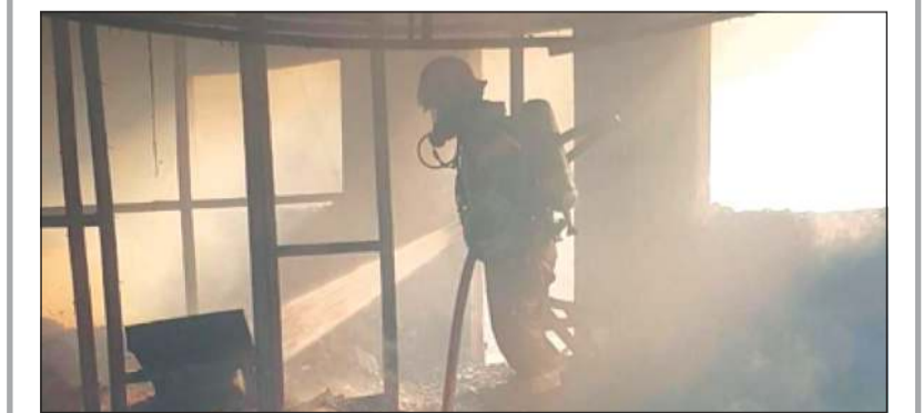
البحث عن سبب الحريق

تسبب اندلاع حريق في التهم وتلف جميع محتويات شاليه في منطقة الخيران طريق 285. وكانت عمليات وزارة الداخلية تلقت في ساعة متقدمة من امس الخميس بلاغاً يفيد بوجود حريق في الشاليه وعلى الفور تم الإيعاز لمركز إطفاء النويصيب بالتعامل مع الحريق وإخماد النيران دون وقوع أي أضرار بشرية، هذا وتم فتح تحقيق في الحريق للوقوف على أسبابه.