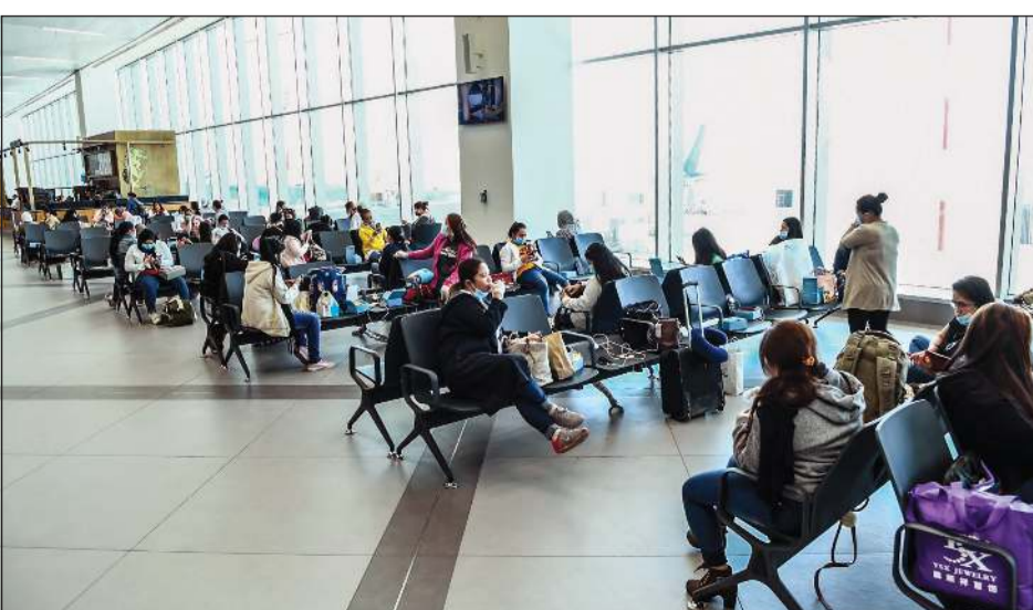
صورة أرشيفية لغارة الفلبينيين المخالفين للإقامة

أعلنت وزارة الداخلية عن أعداد الوافدين المخالفين للإقامة والذين عادوا إلى بلدانهم، وذكرت الداخلية في تغريدة لها أن إجمالي من عادوا هم 6918 وافداً بواقع 4390 مصرياً و1821 فلبينياً و629 بنغلاديشياً و78 إندونيسياً، ومن خلال تغريدة الداخلية، فإنه اتضح استمرار وجود وافدين خاصة من العمالة الآسيوية السريلانكية والهندية وجنسيات أفريقية أخرى في مراكز الإيواء نظراً لإغلاق عدة بلدان مجالها الجوي أمام حركة نقل الأشخاص، ومن المتوقع أن يتم تسفير بقية المخالفين خلال الأسابيع القليلة المقبلة، وجاءت تواجدهم الوافدين في مراكز الإيواء عقب صدور قرار من قبل نائب رئيس مجلس الوزراء ووزير الداخلية أسد الصالح نهاية مارس الماضي يتضمن السماح للمخالفين لقانون الإقامة بالتوجه إلى مدارس جري تخصصها في الفروانية والجليب، وذلك في الفترة من الأول من أبريل وحتى نهايته مع إمكانية العودة إلى الكويت مرة أخرى وتوفير سبل الإعاشة والإقامة وتسفيرهم دون تكلفة مالية. واستفاد من هذه المهلة أعداد كبيرة تتجاوز الـ 20 ألف وافد من مختلف الجنسيات.