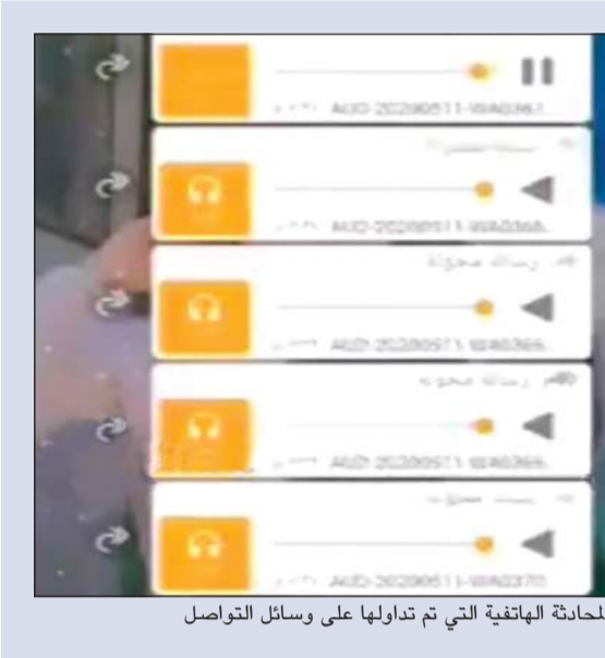
الحادثة الهاتفية التي تم تداولها على وسائل التواصل

ويتمكن بهذه الوسيلة من إسكاتهم وضمان عدم مطالبتهم بحقوقهم. وأشار المصدر إلى أن النيابة استدعت الضابط الذي لديه حساب شعر شهير في موقع التواصل الاجتماعي «إنستغرام» وحققت معه بتهمة إساءة استعمال السلطة والتهديد وتزوير أوراق رسمية. وبذلت نيابة العاصمة برئاسة مديرها ناصر البدر جهوداً