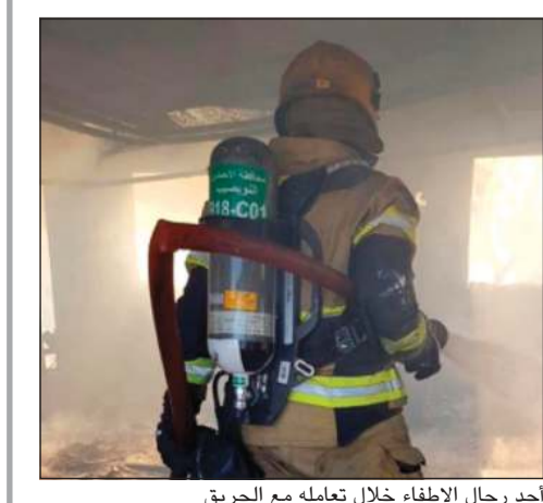
أحد رجال الإطفاء خلال تعامله مع الحريق

تسبب اندلاع حريق في التهم وتلف جميع محتويات شاليه في منطقة الخيران طريق 285. وكانت عمليات وزارة الداخلية تلقت في ساعة متقدمة من امس الخميس بلاغاً يفيد بوجود حريق في الشاليه وعلى الفور تم الإيعاز لمركز إطفاء النويصيب بالتعامل مع الحريق وإخماد النيران دون وقوع أي أضرار بشرية، هذا وتم فتح تحقيق في الحريق للوقوف على أسبابه.