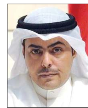
المحامي شريان الشريان

أصدر رئيس جمعية المحامين شريان الشريان بياناً أكد فيه تصدي الجمعية لأي تجاوزات تمارس من قبل بعض المحامين الذين يخالفون ميثاق مهنتهم عبر وسائل التواصل الاجتماعي، مشدداً على تفعيل أدوات الجمعية بالتصدي لكل من يسيء إلى المهنة ولا يتحلى برسالتها. وذكر الشريان أن الجمعية رصدت في الأونة الأخيرة العديد من المخالفات التي اعتاد بعض المحامين ارتكابها وفي مقدمتها ممارسة البعض منهم الدعاية التجارية عبر وسائل التواصل الاجتماعي، متجاهلين بذلك ميثاق شرف مهنتهم. وأكد أن الجمعية تعول على منتسبيها الذين كانوا وما زالوا وسيبقون متمسكين بميثاق شرف مهنتهم