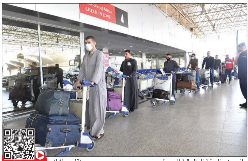
جانب من مغادرة أبناء الجالية المصرية (قاسم باشا)