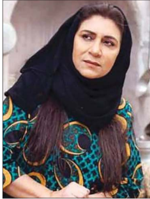
«سلطانة» هيفاء عادل