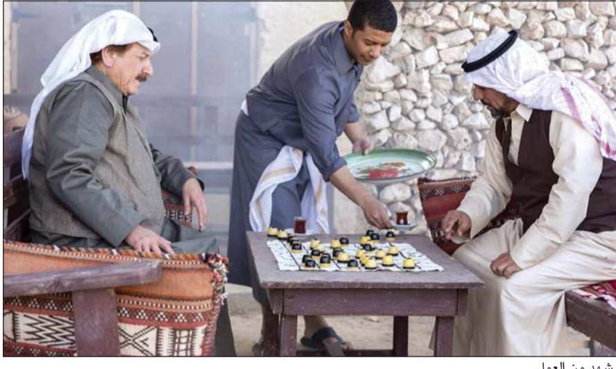
مشهد من العمل