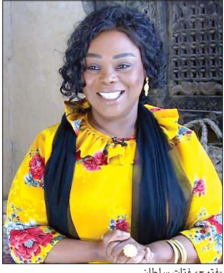
«فتوح» فئات سلطان

لكن هذا الاعتناء بالتفاصيل الصغيرة قابله أيضاً أخطاء بعضها