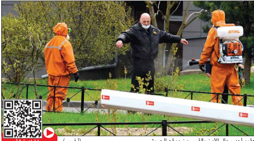
تعميق أحد رجال الأمن بالقرب من موقع الحريق

سان بطرسبورغ، - أ.ف.ب: لقي خمسة أشخاص مصرعهم جراء حريق اندلع صباح الثلاثاء في مستشفى في سان بطرسبورغ، ثاني أكبر مدينة روسية، حيث أقادت وكالة «تاس» للأنباء بأنهم مصابون بكوفيد-19 كانوا موصولين بجهاز تنفس اصطناعي. وأفاد مصدر في وزارة الطوارئ الروسية وكالة فرانس برس بأن «خمسة أشخاص قضوا جراء الحريق، وأجلى 150» آخرون، في حافلة أدها رئيس الفرع المحلي للجنة التحقيق الروسية سيرغي ليتفينكو لوسائل إعلامية. وقال بافل دانيلوف مدعي عام منطقة فيبورغ حيث يقع المستشفى، لصحافيين في المكان إن «الأشخاص الذين