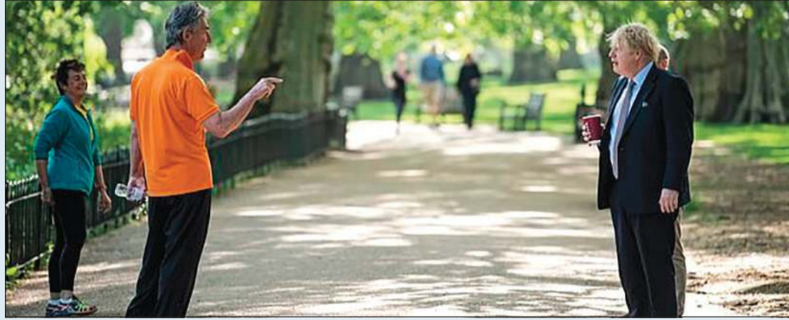
جانب من المواجهة بين بوريس جونسون وبوب ميدوز

تعرض رئيس الوزراء البريطاني بوريس جونسون لموقف محرج خلال نزهة كان يقوم بها في حدائق «سانت جيمز» في لندن مستفيدا من مهلة الساعة المسموح بها للتنزه بموجب إجراءات الحظر المطبقة للوقاية من فيروس كورونا. وذكر موقع «ذي ديلي ميل» الإلكتروني ان جونسون كان يسير ويديه كوب من القهوة عندما فوجئ بمتنزهه غاضب يواجهه اصيغه نحوه منتقدا أسلوب إدارته للزامة. وبدا المسؤول البريطاني مندهشا وهو يتلقى انتقادات الرجل الذي كان برفقة زوجته والذي تبين لاحقا انه المليونير ومدير شركة الاستشارات بوب ميدوز. وامتنع كل من مكتب رئيس الوزراء وميدوز عن الإفصاح عن مضمون المواجهة بين الرجلين ولكن العارفين بميدوز قالوا انه رجل صريح جدا ولا يتردد في التعبير عن رأيه.