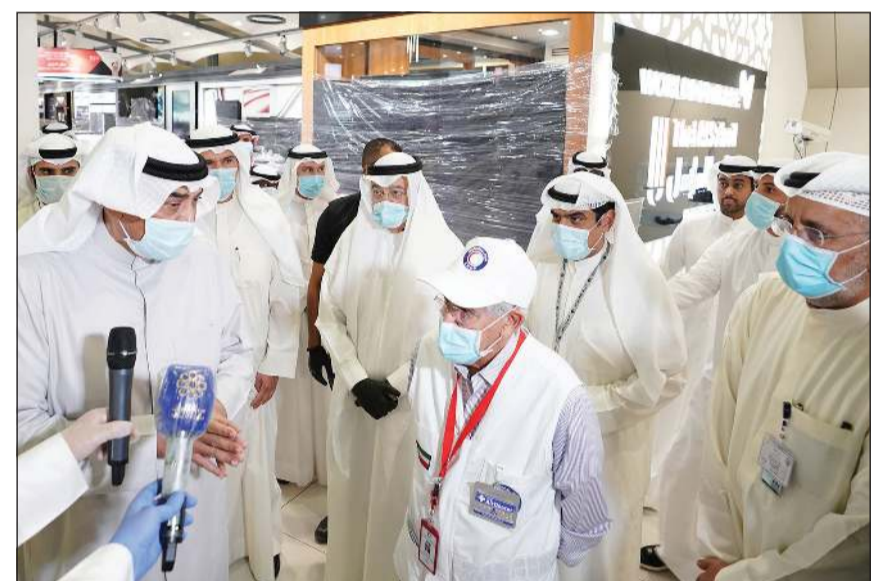
سمو الشيخ صباح الخالد في حديث مع د. هلال السابير خلال الجولة

■ خطة عودة المواطنين إلى البلاد شملت 185 رحلة قادمة من 58 جهة حول العالم