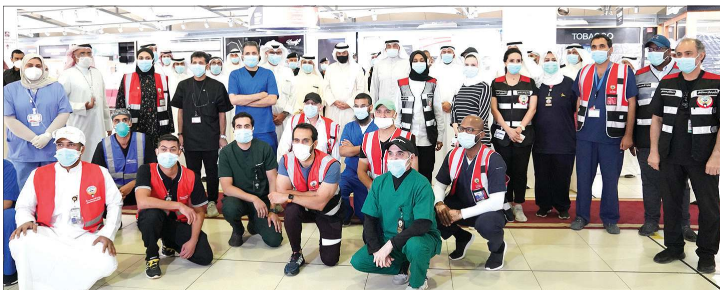
سمو الشيخ صباح الخالد مع عدد من العناصر الطبية والتطوعية في المطار