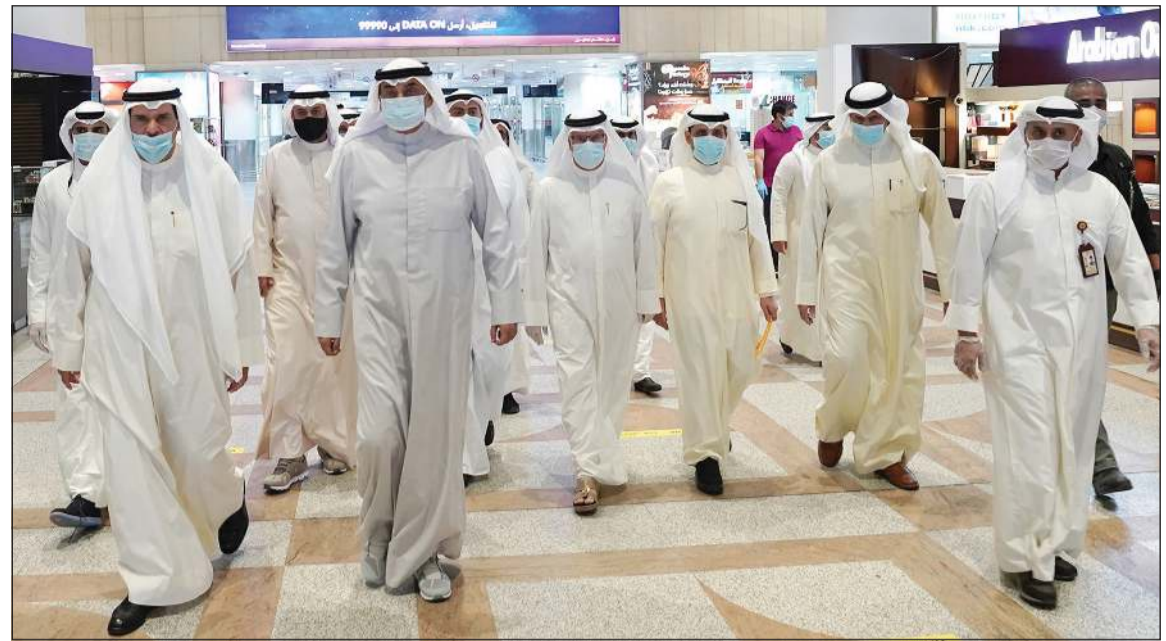
سمو رئيس الوزراء الشيخ صباح الخالد وأنس الصالح والشيخ ديباسل الصباح والشيخ د. أحمد ناصر المحمد والشيخ سلمان الحمود خلال الجولة في المطار

أكد خلال استقبال المواطنين العائدين بالمرحلة الأخيرة لعملية الإجراء أن الأزمة الصحية أربكت العالم ووضعت قيوداً صارمة على كل القطاعات