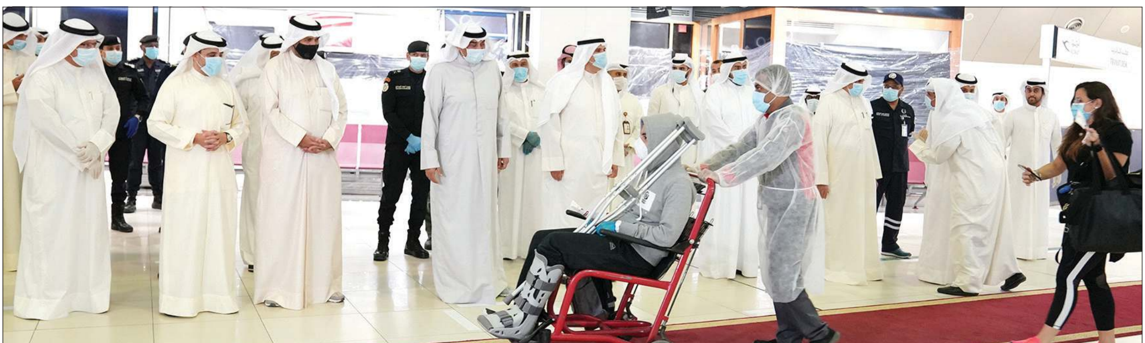
مواطنونا العائدون حظوا بكل اهتمام من الحكومة