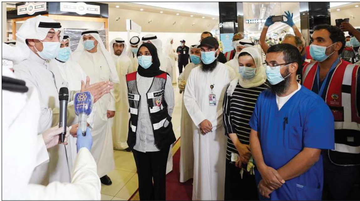
سمو الشيخ صباح الخالد متابعاً سير العمل في المرحلة الأخيرة من إجلاء مواطنينا بالخارج