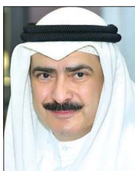
كامل العبد الجليل

ثمن أمين عام المجلس الوطني للثقافة والفنون والآداب كامل العبد الجليل جهود عدد من الفنانين التشكيليين الكويتيين والخليجيين في إقامة معرض «الكويت بيتنا» الرمضاني وذلك تجاوباً من الفن كرسالة إنسانية تضامنية تجاه جائحة وباء كورونا المستجد. وقال العبد الجليل: ان تسخير الفن في زمن الأزمات له تاريخ معروف لدى العديد من الأمم، وذلك لما له من دور حيوي في إعطاء جانب مشرق وبصيص أمل في الأزمات الإنسانية الكبرى كالحروب والأوبئة، حيث تنادي فئة من الفنانين الكويتيين والخليجيين كإحساس منهم بانعكاسات وباء كورونا على النفس البشرية ومحاوله للتخفيف عنها من خلال استجلاء عناصر الفرح والأمل المحفزة للاستمرار في المقاومة والتعلق بالحياة. أكدت منظمة المعرض الفنانة التشكيلية وعضو المرسم الحر ابتسام العصفور أن فكرة المعرض جاءت لاستغلال جائحة كورونا في إبراز دور الفن التشكيلي في التخفيف من الضغوط النفسية على ملايين البشر جراء الحجر المنزلي ومحاولة لرسم الفرحة في نفوسهم. وأضافت العصفور أن عدد المشاركين من الكويت ودول الخليج العربية بلغ 22 مشاركاً ومشاركة عرضوا من خلال أعمالهم صوراً ورؤى مختلفة سواء في التجريد أو الواقعية وبخطوط فنية مختلفة.