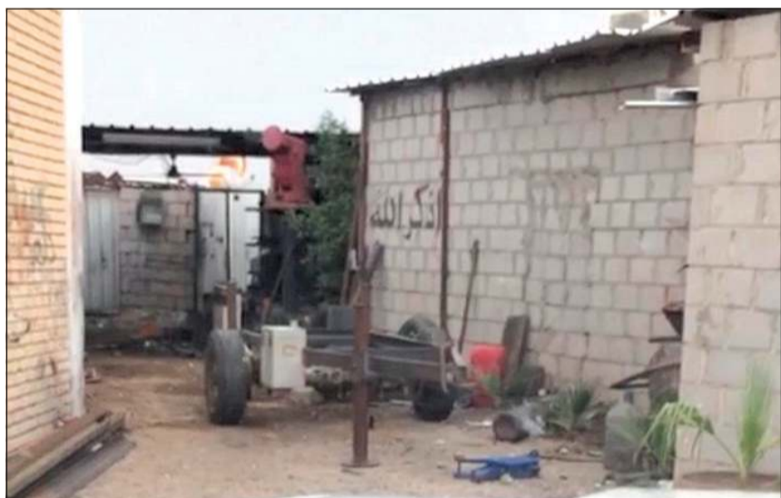
كراجات لتخزين مواد السكراب أمام المحطات