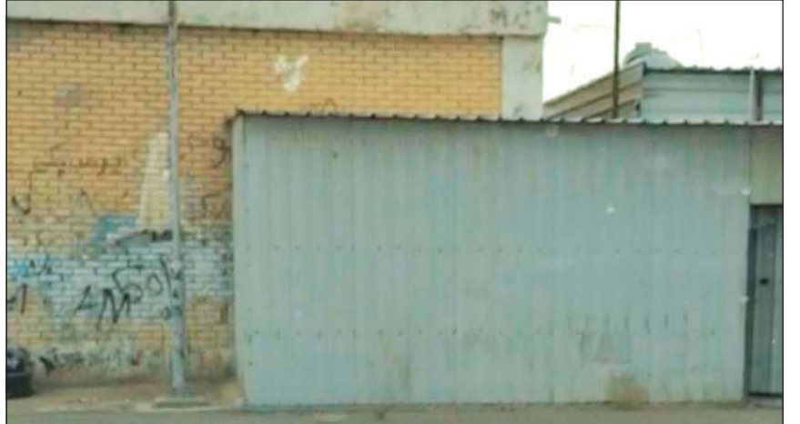
بقالة أمام إحدى المحطات الثانوية في الجهراء