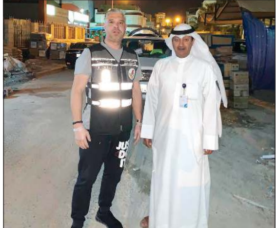
فريق الضبطية القضائية والشؤون القانونية في قطاع الشبكات أثناء التعامل مع بلاغات العبث بالعدادات

أكد نائب رئيس الضبطية القضائية في وزارة الكهرباء والماء وعضو لجنة العزاب واللجنة المشتركة أحمد الشمري أن الوزارة أعدت التيار إلى 5 شقق وملاحق كان ملاك العمارات وحراسها قد قاموا بفصل التيار عنها لتخلف قاطناتها عن دفع الإيجارات. وأكد الشمري في تصريح خاص لـ «الأنباء» أنه منذ بدء شهر رمضان