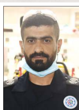
سيد مهدي الكاظمي