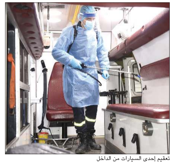
تعقيم إحدى السيارات من الداخل