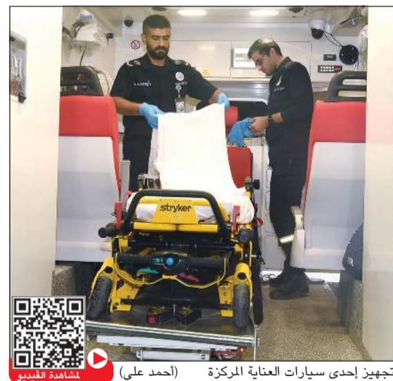
تجهيز إحدى سيارات العناية المركزة (أحمد علي)

وعن تلقي بلاغات الإصابة، قال القبندي ان هناك حجرا مؤسسيا وآخر منزليا، والأخير تشرف عليه الصحة العامة والصحة الوقائية ودائما ما يتم عمل مسحات لهم وهم