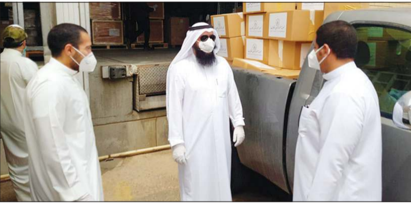
رئيس جمعية المهندسين خلال توزيع الأقنعة