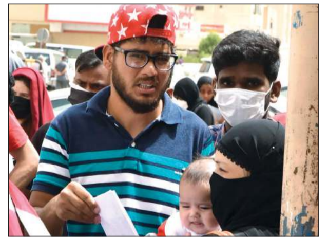
أسرة آسيوية، الأب والأم والطفل، مخالفة مقابل مدرسة الاستقبال

صاحب المركبة تراجع عن تسجيل قضية بعد اكتشافه الحقيقة كاميرا منزل تكشف حادثة شديدة الغرابة الجاني في إتلاف مركبة مواطن.. كلاب مفترسة!