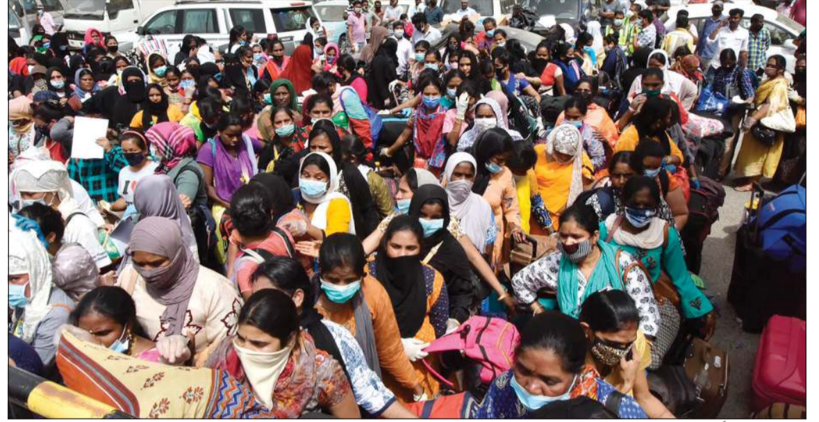
أعداد كبيرة جداً من النساء تتدفق منذ الصباح الباكر للحاق بالمهلة في يومها الأخير

■ لم ترد حتى الآن تعليمات بالتمديد للمهلة وقرار الحسم في يد وزير الداخلية ■ 150 ألف مخالف معرضون للملاحقة اعتباراً من الجمعة ما لم يصدر قرار جديد بالتمديد