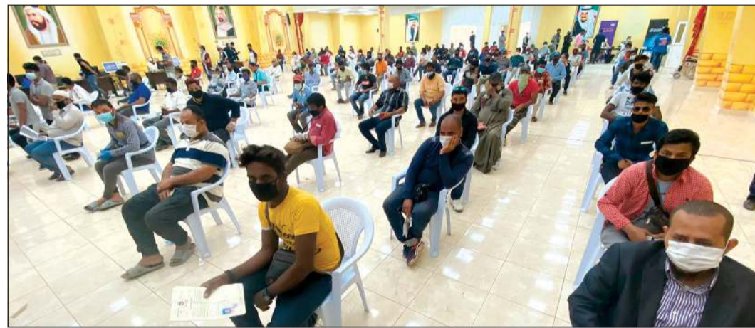
رجال مخالفون داخل الاستقبال لإنهاء إجراءات الاستفادة من المهلة