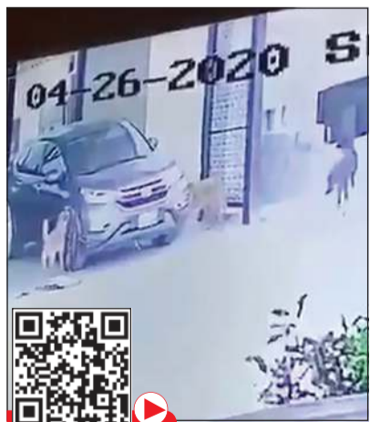
الكاميرا سجلت جريمة الكلاب

المواطن صباح أمس ليجد مركبته قد تعرضت للتلفيات البليغة، خاصة من جهة الإطار، حيث اعتقد أن هناك شخصاً تعمد فعل ذلك. ونظراً لوجود كاميرا منزلية قريبة من موقع الحادث قام بمراجعة الكاميرا وإذ بها تكشف له أن كلبين ضالين هما اللذان قاما بنهش سيارته وتعمد اتلافها، وهكذا كان المقطع الذي شاهده المواطن كفيلاً بإحداث صدمة له واكتفى بتسجيل إثبات حالة لعل الجهات المختصة تقوم بالتخلص من الكلاب الضالة في منطقة شمال غرب الصليبخات، مؤكداً أن ما حدث لا يساوي شيئاً مقابل أن تقوم هذه الكلاب بإصابة طفل أو نهش جسده.