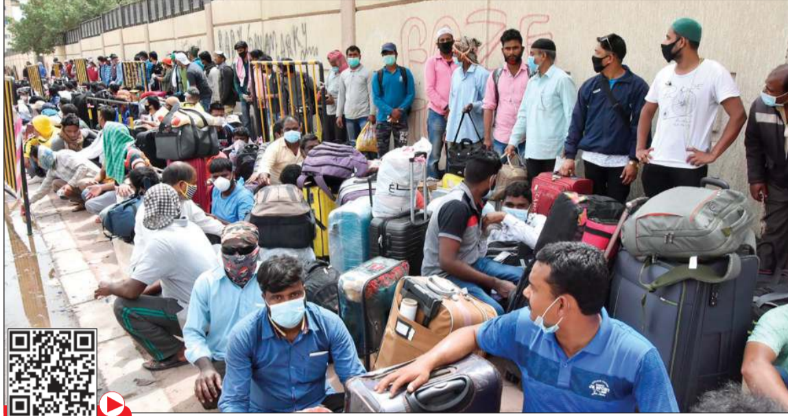
الرجال من مختلف الجنسيات تواجدوا منذ انتهاء الحظر للاستفادة من المهلة في اليوم الأخير لها (محمد هندواي)