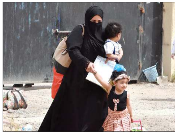
أم وطفلاها داخل مدرسة الاستقبال

انفراجة ابلق مصدر مسؤول «الأنباء» عن وجود انفراجة ايجابية لحل قضية الوافدين المخالفين للإقامة العالقين في مراكز الايواء التابعة لوزارة الداخلية بعد التنسيق مع سفاراتهم لتسيير رحلات المغادرة. 1350 ديناراً اكثر مبلغ تم دفعه 1350 ديناراً للشخص آسيوي كان مطالباً لاحدى شركات الاتصالات بعد خصم 730 من قيمة المبلغ ليدفع 1000 فقط. تجمهر شهد مركز الاجلاء في منطقة الحليب تجمهراً كثيفاً من الجنسية الهندية مطالبين بترحيلهم عن البلاد، وتواجد رجال الداخلية على رأسهم اللواء صالح مطر العززي. الجنسيات الأفريقية تواجد المخالفون من جميع الجنسيات، حيث تغلب عليهم الجنسية الأفريقية التي تشهد تزايداً يوماً بعد يوم وتسهيلاً كبيرة من رجال الداخلية والمتطوعين مع تواجد القنصليات في مراكز الايواء لاستخراج الوثائق في اليوم قبل الأخير.