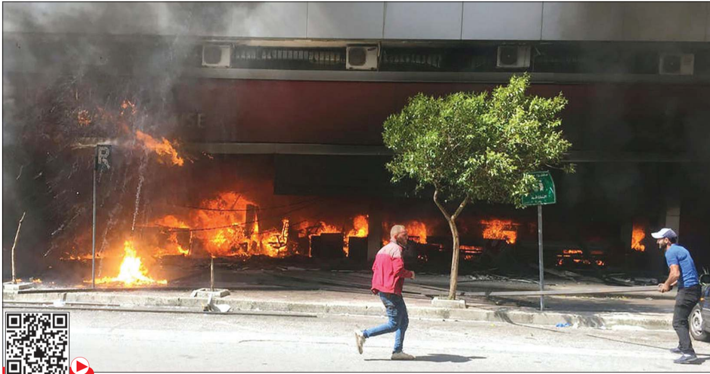
محتجون خلال أعمال شغب وتحطيم واجهات المصارف في طرابلس أمس الأول

هذه الخطة في جلسة مجلس الوزراء برئاسة الرئيس ميشال عون في بعدا اليوم. وكان رئيس الحكومة النقي السفيرة الأميركية في بيروت دوروثي شيبا، وأبلغت تصريحات وزارة الخارجية الأميركية بالمحافظة على حق التظاهر السلمي في لبنان وباستمرار الاهتمام الأميركي بالجيش اللبناني. كما تلقى اتصالا من وزير الخارجية الفرنسية جان إيف لوبريان، مجددا استعداد بلاده للتحرّك مع مجموعة الدول الداعمة وتقديم المساعدة للبنان استنادا إلى الخطة الإنقاذية المطلوبة. من جانبه، رد حاكم مصرف لبنان المركزي رياض سلامة على الحملة التي استهدفته فيما آلت إليه الأوضاع المالية في لبنان، وخصوصا انتقادات رئيس الحكومة حسان دياب له مباشرة، مكتفيا من خلال فيديو مسجل، بث تلفزيونيا، بالحدث في الأرقام دون الأسماء، وقال سلامة: البنك المركزي مؤل الدولة لكن هناك من صرف الأموال، وهناك مؤسسات في الدولة تستطيع أن تعرف من صرف الأموال.. ونحن مؤلنا جزءا من القطاع المصرفي الذي تولي أيضا تمويل الدولة مع الصناديق والمؤسسات الدولية. وشدد حاكم مصرف لبنان المركزي: مصرف لبنان وزع