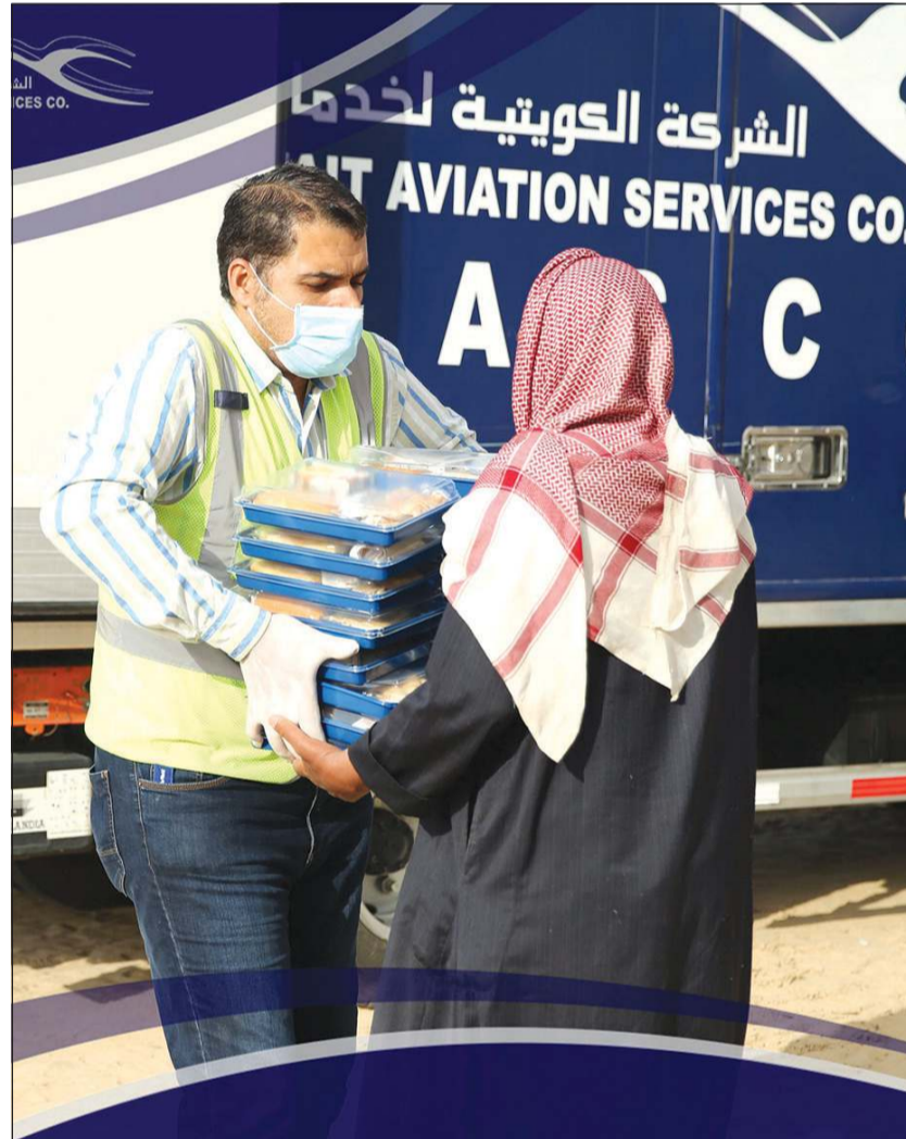
جانب من تسليم الوجبات

وأشار إلى أن الشركة قامت في هذا التوقيت بعمل مبادرة وطنية إلى مجلس الوزراء ووزارة الصحة باعتبارها شركة حكومية مملوكة بالكامل إلى شركة الخطوط الجوية الكويتية، وتتلخص هذه المبادرة في وضع كل إمكانيات الشركة تحت تصرف الحكومة، وتم عمل خطة لتزويد المحاجر الصحية وطاقم وزارة الصحة والعاملين في الصفوف الأمامية، وكذلك