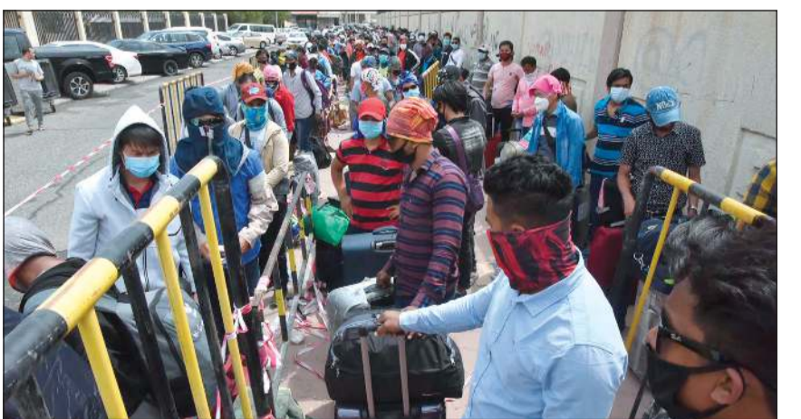
المخالفون امام مدرسة الاستقبال