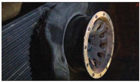
رئج متلف وجد داخل السيارة

تمكن رجال الإدارة العامة للمرور أول من أمس من ضبط شاب كويتي أقدم على ممارسة وصلة استهتار «مرعبة» في منطقة الدوحة. وقال مصدر أمني إنه فور تداول مقطع لوصلة استهتار خطيرة لمركبة وانيس، استطاع رجال المرور في غضون 3 ساعات من ضبط المستهتر وحالة المركبة المستهتر إلى كراج الحجز.