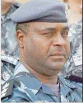
العميد عبدالله سفاح الملا