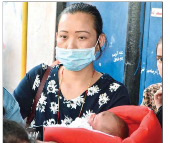
مخالفة حضرت للسفر برفقة طفلها الرضيع

أخرى. وقال مصدر أمني إنه مع استمرار تدفق المخالفين بهذه الأعداد الكبيرة ونظراً لرغبة بعض السفارات في تمديد المهلة، تنجّه الوزارة إلى تمديد المهلة لمدة شهر إضافي، مشيراً إلى أن وزارة الداخلية لاتزال تدرس هذا الخيار. وأشار المصدر إلى أن الوافدين الذين تدفقوا خلال الأيام القليلة الماضية منهم وافدون من جنسيات سبق أن فتح لهم المجال، مشيراً إلى أن مدارس الاستقبال تواصل