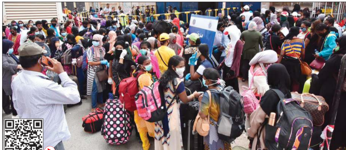
المخالفات من جنسيات مختلفة

أخرى. وقال مصدر أمني إنه مع استمرار تدفق المخالفين بهذه الأعداد الكبيرة ونظراً لرغبة بعض السفارات في تمديد المهلة، تنجّه الوزارة إلى تمديد المهلة لمدة شهر إضافي، مشيراً إلى أن وزارة الداخلية لاتزال تدرس هذا الخيار. وأشار المصدر إلى أن الوافدين الذين تدفقوا خلال الأيام القليلة الماضية منهم وافدون من جنسيات سبق أن فتح لهم المجال، مشيراً إلى أن مدارس الاستقبال تواصل