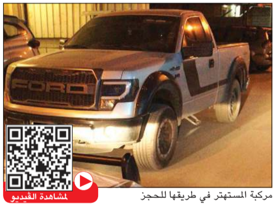
مركبة المستهتر في طريقها للحجز