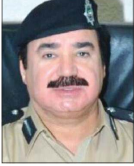
اللواء عبدالله العلي