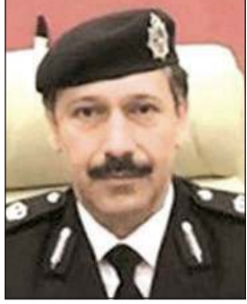
اللواء عابدين العابدين