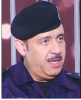
اللواء عبدالقادر شعبان