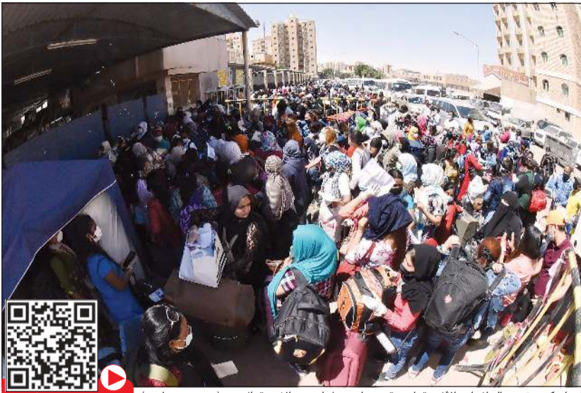
أعداد كبيرة من الوافدين الأفريقيات تقدمن اسم مدارس «الاستقبال» (محمد هندواي) مشاهدة الفيديو