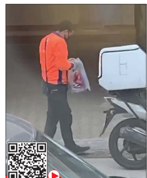
الوافد «الدليقري» يعث بالقمامة ومن ثم يمسك بالأطعمة قبل توصيل الطلاب