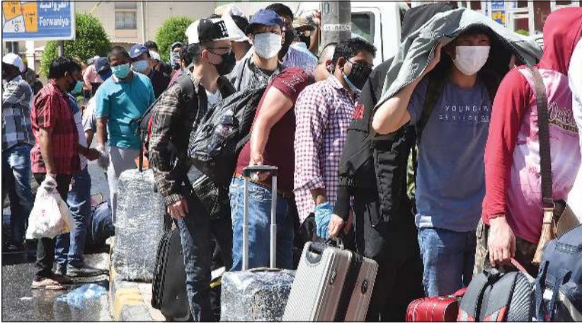
طوابير من المخالفين للإقامة اصطفتوا منذ ساعات الصباح الأولى