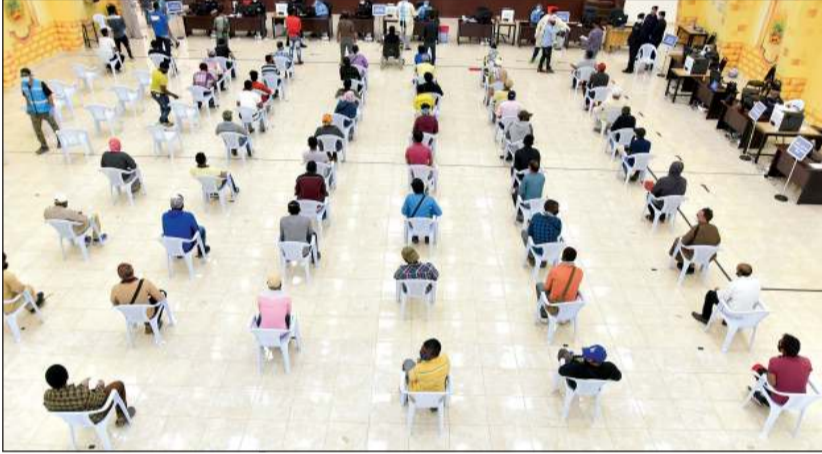
المخالفون داخل مدرسة «الاستقبال» لإنهاء إجراءاتهم

والخمسة أيام الأخيرة من شهر أبريل الجاري لجمع الجنسيات. جدير بالذكر ان المهلة التي صدرت بقرار وزاري تتيح للمخالفين السفر على نفقة الدولة وعدم دفع غرامات وإمكانية العودة وتوفير الإعاشة حتى مغادرتهم إلى بلدانهم.