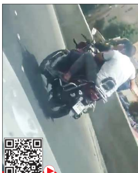
قائد الدراجة ضبط من رقم اللوحة