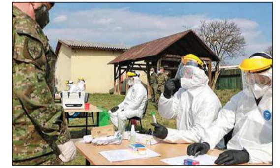
جانب من اختبارات فحص كورونا في إحدى المستشفيات الخمس

باريس - أ.ف.ب: تشكل جدران المدن الكبرى لوحاً كبيراً لأعمالهم عادة، لكن في ظل إجراءات العزل بات فنانون الشارع يتواصلون مع جمهورهم عبر الشبكات الاجتماعية، معربين عن قلقهم وهمومهم في خضم وباء كوفيد-19. وكتب «إنفايدر» أحد نجوم فنون الشارع عبر «إنستغرام»، «لقد أنجزت هذه الفسيفساء عن دكتور هاوس قبل أربع سنوات على جدار مستشفى باريس إلا أن موضوعها أتى أكثر من أي وقت مضى. أهني المرضى الذين يتقنون أرواحاً». يرى فنانون كثر عبر العالم أعمالهم تأخذ بعداً جديداً مع المستجدات الراهنة. ويقول إيدي كولا بشأن عمل له يظهر امرأة تضع قناعاً مع رموز صينية حول وجهها، «يسألني الناس إن كان هذا العمل على علاقة بفيروس كورونا». ويوضح الفنان لوكالة فرانس برس وهو معزول في كاليفورنيا في الولايات المتحدة «لقد أنجزته قبل ثمانية سنوات. هو عمل يتناول الخوف والعزلة والخارج الذي يهدد بيئة الفرد المباشرة» وهي هموم تبدو «أتية» في المرحلة الحالية. ويتملك الشعور نفسه الفنان اندير الذي ينشر رسومه في شرق باريس وتتمحور في الملائكة والأطفال.