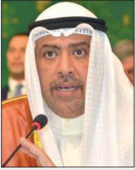
الشيخ أحمد الفهد

لاستضافة دورتنا 21 للألعاب الآسيوية عام 2030، مضيفاً أن ذلك يظهر الثقة والاطمئنان في الحركة الأولمبية في آسيا، ويعزز سمعتها في استضافة أحداث رياضية بمستوى عالمي على نطاق واسع. وذكر الفهد أنه أصبح لدينا مع هذين العرضين لاستضافة الألعاب الآسيوية عام 2030 استقرار واستمرارية في حركتنا الرياضية للعقد المقبل. وستتيح ذلك للجائز الأولمبية الوطنية، ولاداريينا، وقبل كل شيء لرياضييننا، وضع خطط قوية للمستقبل على المدى القصير والمتوسط والطويل. إنه يضعنا في موقف نحسد عليه من حيث الرزنامة الرياضية، ويسلط الضوء مرة أخرى على أن آسيا هي شريك رئيسي في الحركة الأولمبية العالمية.