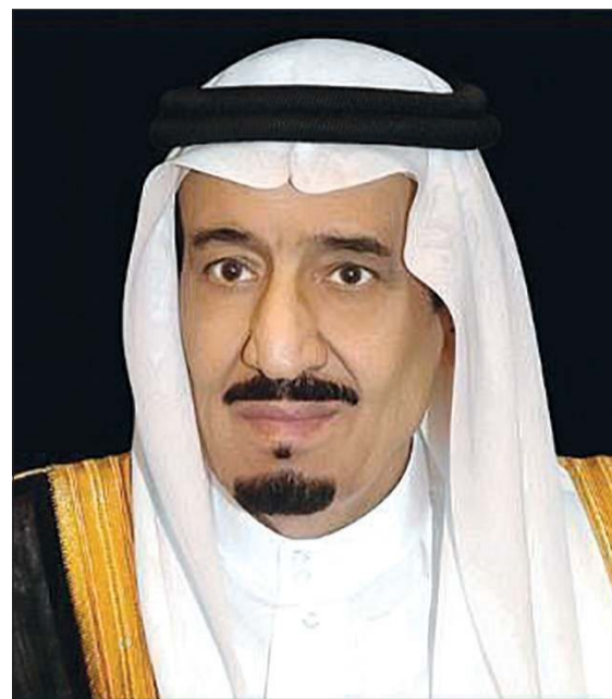
خادم الحرمين الشريفين الملك سلمان بن عبدالعزيز

دائمة لكل إنسان، ورحمة واسعة لكل من انتقل إلى رحمة الله». وأضاف الملك سلمان في الكلمة التي نقلتها وكالة الأنباء السعودية (واس) وجاء فيها «لقد دخل علينا رمضان هذا العام ونحن نعيش هذا الظرف البالغ الأثر على البشرية كافة، والمرحلة الصعبة والحساسة من تاريخ العالم، من تفشي جائحة فيروس كورونا المستجد، رغم ما اتخذته المنظمات الإنسانية ودول العالم من إجراءات لمنع وكما نتشرف بما تفضل الله به علينا من شرف عظيم ومكانة جليلة ومرتبة رفيعة بين الأمم، حيثما اختصنا بخدمة