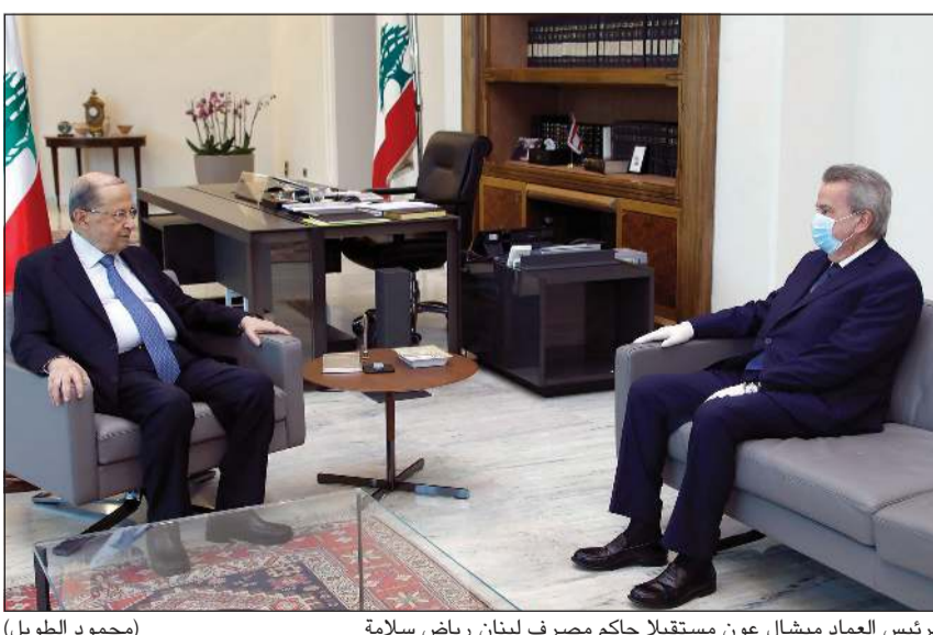
الرئيس العماد ميشال عون مستقبلاً حاكم مصرف لبنان رياض سلامة (محمود الطويل)

بما وصفه بالأدلة الثبوتية طالبا اتخاذ التدابير القانونية في هذه المجال. وسط هذه المعمة السياسية المالية كشف النائب أسس عن طلب مؤسسة كهرباء لبنان إلى المصرف المركزي فتح اعتماد بالدولار وفق السعر الرسمي (1507 ليرات للدولار) بقيمة 312,9 مليون دولار تحت عنوان «المصاريف التشغيلية للشركات المدومة من الأوصياء السياسيين على قطاع الكهرباء كما تقول صحيفة «نداء الوطن» بحيث تصبح حصة إحدى الشركات المشغلة 90 مليون دولار والأخرى 40 مليون دولار والمقدمي الخدمات 81 مليون دولار عن ان الكلفة الفعلية، تقول الصحيفة، هي 20 مليون دولار فقط.