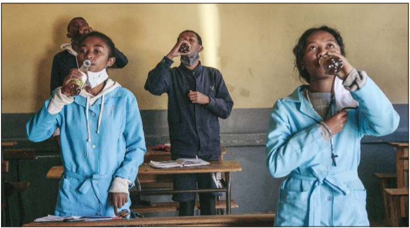
تلاميذ يشرّبون من دواء كوفيد العسوي الذي يروج له رئيس مدغشقر أندري راجولينا كعلاج لفيروس كورونا (أ.ف.ب)

عواصم - وكالات: حذرت منظمة الصحة العالمية من ضياع المكاسب التي تحققت في مجال التطعيم ضد الأمراض الوبائية الأخرى، في حال انشغال الخدمات الصحية بمكافحة جائحة فيروس كورونا المستجد - «كوفيد-19». وأضافت المنظمة في بيان بمناسبة (الأسبوع العالمي للتطعيم) أمس أن إغفال عمليات التطعيم ضد مختلف الأمراض قد يتسبب في عودة ظهور أمراض يمكن الوقاية منها بلقاحات مأمونة وفعالة. وأوضحت أن تعطل خدمات التطعيم في أثناء حالات الطوارئ حتى وإن كان ذلك لفترات قصيرة يزيد من خطر حدوث تفشي أمراض يمكن الوقاية منها باللقاحات مثل الحصبة وشلل الأطفال. وأشارت إلى عودة مرض الحصبة الفتاك إلى الكونغو العام الماضي فأودت بحياة أكثر من 6000 شخص بينما كان البلد يواجه فيروس «إيبولا». ونقل البيان عن مدير منظمة الصحة العالمية تيدروس غيبريسوس تحذيره من «عدم المجازفة بخسارة المعركة التي نخوضها من أجل حماية الجميع في كل مكان ضد الأمراض التي يمكن الوقاية منها باللقاحات