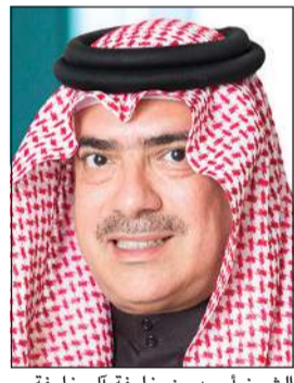
الشيخ أحمد بن خليفة آل خليفة

تفخر مجموعة جي أف إتش المالية بأن تكون دائماً مساهماً رئيسياً في دعم المبادرات الوطنية وتلبية نداء الواجب الوطني والوقوف مع مملكة البحرين في جميع الظروف والأوقات وذلك من خلال التزامها بمبدأ الشراكة المجتمعية والإيمان بأهمية المساهمة في المحافظة على ما تحقق في مملكة البحرين من مكتسبات حضارية وتنموية في مختلف المجالات والتعاون مع المبادرات الوطنية لمواجهة والتأثيرات الناجمة عنه، وعليه فإنه استجابة من مجموعة جي أف إتش المالية لحملة «فيينا خير» التي أطلقها الشيخ ناصر