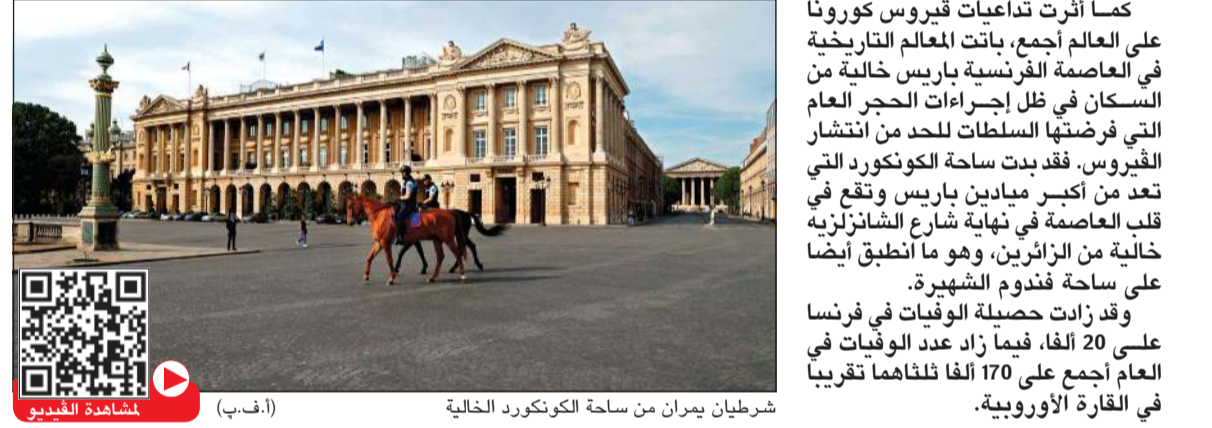
شريطان يمران من ساحة الكونكورد الخالية

كما أثرت تداعيات فيروس كورونا على العالم أجمع، باتت المعالم التاريخية في العاصمة الفرنسية باريس خالية من السكان في ظل إجراءات الحجر العام التي فرضتها السلطات لحد من انتشار الفيروس. فقد بدت ساحة الكونكورد التي تعد من أكبر ميادين باريس وتقع في قلب العاصمة في نهاية شارع الشانزلزيه خالية من الزائرين، وهو ما انطبق أيضاً على ساحة فندوم الشهيرة. وقد زادت حصيلة الوفيات في فرنسا على 20 ألفاً، فيما زاد عدد الوفيات في العام أجمع على 170 ألفاً نلناهم تقريبا في القارة الأوروبية.