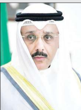
السفير سميح جوهر حيات

ستحمل أيضاً على متنها اليوم عشرات الاطنان من المستلزمات الطبية والوقائية مشتركة بالتنسيق العالي المستوى مع الحكومة الصينية والشركات الصينية الحكومية المعتمدة من جانبها، والتي تتسم بالجودة العالية في محتوياتها، وأثبتت فعاليتها في الوقاية، حيث بعد ان يتم الانتهاء من تحميل طائرة الشحن التابعة للطائر الأزرق بالمستلزمات الطبية والوقائية، ستغادر فوراً اليوم في طريقها إلى البلاد، وذلك لتعزيز المخزون الاستراتيجي في وزارة الصحة العامة.