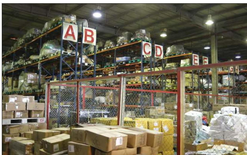
جانب من البضائع