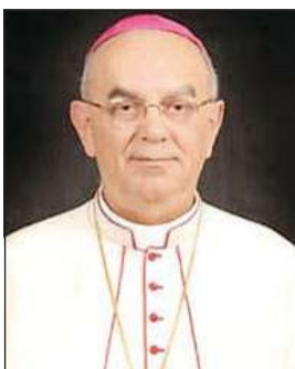
المطران كاميللو بالين

وتقديم هدية له في الفترة من 14 - 16 ديسمبر 2009». وختم قائلاً «الرب يعزي قلوب كل أحبائه». يذكر أن المطران بالين الإيطالي الجنسية، ولد عام 1944، حيث خدم الكنيسة الكاثوليكية في السودان لمدة 10 سنوات، كما خدم في الكنيسة الكاثوليكية في مصر لمدة 24 عاماً، وكان يجيد اللغة العربية بطلاقة، وحصل على درجة الدكتوراه في العام 2000، وعيّنه البابا بنديكتوس السادس عشر خلال العام 2005 نائباً رسولياً في الكويت، وفي العام 2011 نائباً رسولياً لشمال شبه الجزيرة العربية، بحيث أشرف على الحضور الكنسي الكاثوليكي في كل من الكويت والبحرين وقطر والمملكة العربية السعودية. ولعب الراحل بالين دوراً كبيراً في تعزيز العلاقات بين القاتيكان ودول الخليج.