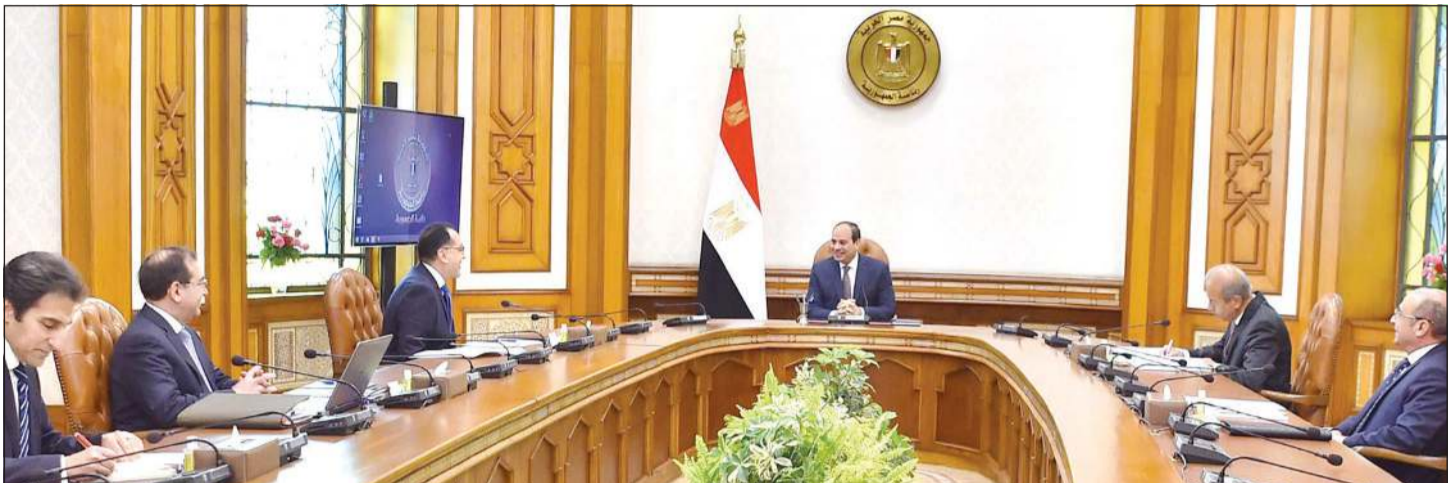
جانب من اجتماع الرئيس عبدالفتاح السيسي مع رئيس الحكومة ومساعدي رئيس الجمهورية للمشروعات القومية والإستراتيجية ووزير البترول والثروة المعدنية ووزير العدل

به الحكومة من إجراءات وجهودات. وأكد الرئيس أن الدولة ستواجه بكل حزم أي مخالفات أو تجاوزات تضر مصلحة الوطن والمواطنين حتى تتجاوز المحنة بسلام ونحافظ على ما حققناه من نجاح حتى الآن. كما وجه الرئيس عبدالفتاح السيسي بضمّن الحفاظ على الاحتياطي الإستراتيجي للدولة من المواد البترولية، مع أهمية التزام كل المشروعات التابعة لقطاع البترول باتخاذ الإجراءات الوقائية والاحترازية اللازمة لحماية العمالة من الإصابة بعدوى كورونا.