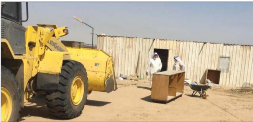
إزالة احد التعديلات خلال الحملة

كما قام الفريق أيضاً بإزالة أسلاك وشبك وجواخير ومخيمات في بر كبد، وذلك ضمن الجهود المستمرة للبلدية في العمل على تطبيق القوانين واللوائح الخاصة بهذا الشأن.