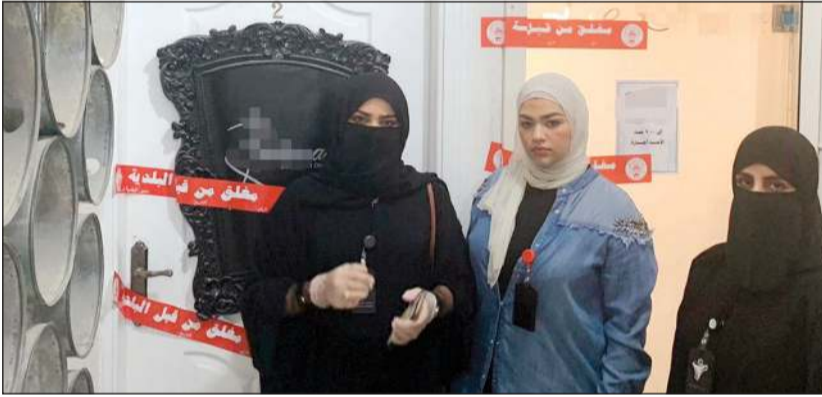
جانب من إغلاق الصالون النسائي

من جانب آخر، قام الفريق الرقابي بفرع بلدية محافظة الفروانية بغلق مخزن ومطعم بالتعاون مع الجهات المعنية، كما قام الفريق أيضاً بإغلاق محلين عقب الكشف على 10 محلات وتعامل مع 4 شكاوى.