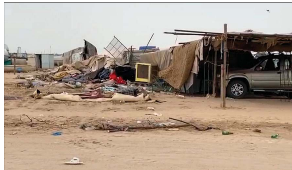
جانب من المخالفات في سوق الأعلاف

اعلنت إدارة العلاقات العامة في البلدية عن قيام إدارة النظافة العامة وإشغالات الطرق بالجهراء ممثلة في مراقبة إشغالات الطرق - النوبة «ج» بالتعاون مع فريق الطوارئ بفرع بلدية المحافظة ومساندة أمنية من وزارة الداخلية باستكمال تنفيذ الجولة الميدانية على سوق الأعلاف بمنطقة رحية في إطار الجهود المبذولة من قبل البلدية لاتخاذ الإجراءات الاحترازية والوقائية تجنباً لانتشار فيروس كورونا المستجد.