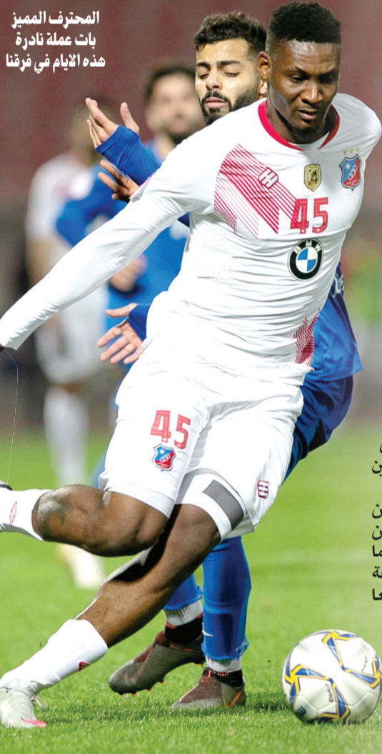
المحترف المميز بات عملة نادرة هذه الأيام في فرقنا

وأوضح الكندري ان 15٪ من المحترفين الأجانب الذين ينشطون في الملاعب الكويتية بارزون، فيما النسبة البقية لم تقدم أي إضافة بسبب تواضع مستوياتهم، مرجعا هذا السبب الى عدم توافر البيئة المناسبة لاستقطاب محترفين مميزين وتواضع مستوى البطولات المحلية وعدم وجود منشآت حديثة وغياب الإعلام وضعف المقابل المادي.