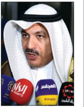
م. ديعج العتيبي

أعلن أمين عام الاتحاد الآسيوي للرمية م. ديعج العتيبي تأجيل البطولات القارية لآسيا لعام 2020، حيث ستقام البطولة القارية لآسيا لمسابقات الشوزن السكيت والتراب الأولمبي بالصين إلى أكتوبر 2021، كما ستقام البطولة الآسيوية المؤهلة لدورة الألعاب الأولمبية للشباب والمعتمدة من قبل الاتحاد الآسيوي بجمهورية كازاخستان إلى