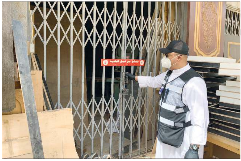
إغلاق احد المحلات المخالفة في العاصمة

الميدانية بناء على خطة عمل تم وضعها لرصد جميع المخالفات واتخاذ كل الإجراءات وفقاً لكل القرارات الصادرة من الجهات المعنية. وذكر أن مفتشي النوبات أغلقوا 114 محلاً إدارياً وجرروا 114 مخالفة وفق لائحة المحلات عقب الكشف على 6742 محلاً. وأشار إلى أنه تم التعامل مع 459 بلاغاً وارداً عبر الخط المباشر للفريق من قبل المفتشين، لافتاً إلى أن الجولات الميدانية مستمرة لرصد أي مخالفة واتخاذ الإجراءات بحقها على الفور وفق الاطر القانونية.