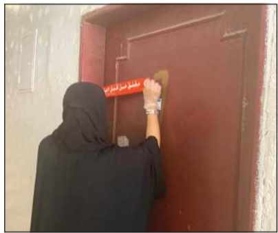
إغلاق المشغل المخالف

في إطار الجهود المتواصلة للفرق الرقابية في مختلف بلديات أفرع المحافظات، قام الفريق الرقابي في فرع بلدية الجهراء بإغلاق مشغل مخالف للقرارات الصادرة من الجهات المختصة، وذلك عقب الإجراءات التي قامت بها مختلف الجهات للحد من انتشار فيروس كورونا المستجد. من جانب آخر، قام الفريق الرقابي ببلدية محافظة العاصمة بتنظيف وكس الشوارع الرئيسية والفرعية بالمحافظة، كما قام الفريق بغلق محل زهور ونباتات لمخالفته قرار مدير عام البلدية رقم 703 لسنة 2020.