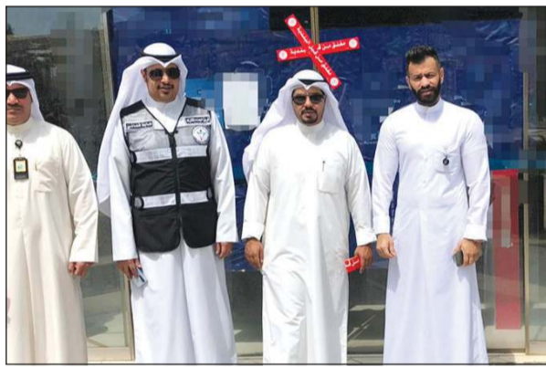
فريق البلدية عقب إغلاق المخزن في حولي

قام الفريق الرقابي بفرع بلدية محافظة حولي بالتعاون مع اللجنة المشتركة بإغلاق 4 محلات إدارياً وذلك لمخالفة قرارات الجهات المختصة. من جانب آخر، قامت الفرق الرقابية أيضاً بغلق مخزن استغل في نشاط الخياطة بالمخالفة لقرارات الجهات المختصة.