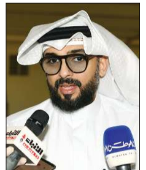
عبدالعزیز الشعبي متحدئا

وعدم تحميل جمعية الفنتاس كامل العبء والمسؤولية، حيث يتم دراسة الاستعانة بجمعية الرقة التعاونية وفتح أبوابها أمام القاطنين في الفنتاس للشراء والتسوق. ودعا القائمين على الفرع الميداني إلى ألا تطول فترة التسوق أكثر من ربع ساعة مع تقنين المشتريات، مشيرا إلى أن الفرع تم إنشاؤه على مساحة 2000 متر في القاعة الرياضية لمدرسة «إنفا»، حيث سيقوم الدفاع المدني بتنظيم عملية دخول المتسوقين والتأكد من الإجراءات الوقائية الاحترازية. وخلال الجولة قال الشعب: إن جميع المنتجات متوفرة وحتى الخبز تم توفيره بكميات كبيرة، حيث تم تنزيل 150 ألف كيس خبز في المهبولة، و200 ألف كيس خبز في الجلب ولا يوجد نقص في هذه المادة إضافة إلى التوافق مع شركة «أمريكانا» و«نستلة» لتزليل منتجاتها وملعباتها في الأسواق والفروع التعاونية بعد التنسيق معهم