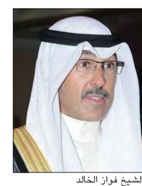
الشيخ فواز الخالد

أعرب محافظ الأحمدية الشيخ فواز الخالد عن شكره إلى رئيس وأعضاء مجلس إدارة جمعية الفنتاس التعاونية وجميع العاملين والمتطوعين فيها على جهودهم المخصصة وأدائهم المتميز وتفانيهم في خدمة أهالي منطقة المهبولة على نحو خاص في ظل قرار الحجر المنطقي الكامل القائم عليهم حالياً، وذلك جنباً إلى جنب مع عملهم الدؤوب لتلبية احتياجات المساهمين وقاطني المنطقة على مدار الساعة. وأوضح الخالد أن سرعة إطلاق خدمة الفرع الميداني لجمعية الفنتاس في منطقة المهبولة ليغطي نسبة كبيرة من احتياجات