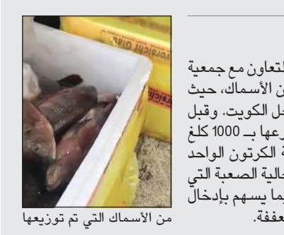
من الأسماك التي تم توزيعها