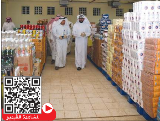
جولة في الفرع الجديد بمدرسة «إنفا»