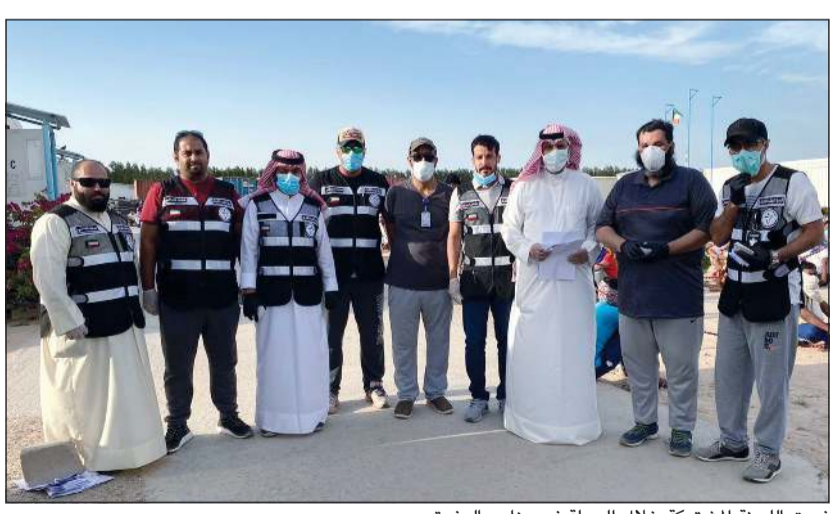
فريق اللجنة المشتركة خلال الجولة في مزارع الوفرة