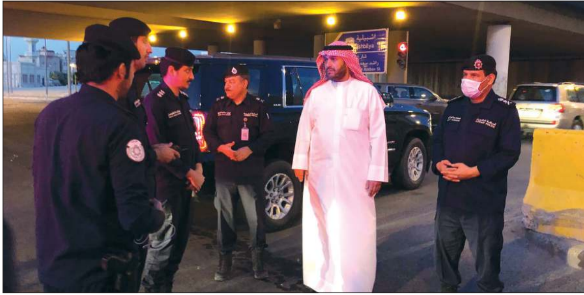
.. وخلال جولة تفقدية في منطقة الجليب وإلى جواره وكيل وزارة الداخلية الفريق عصام النهام