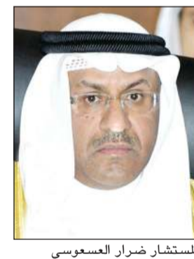
المستشار ضرار العسوس

باشرت النيابة العامة تحقيقاتها بقضية الاتجار بالبشر والتسبب بتجنمهم العمال أخيراً في منطقة الفروانية، المتهم بها مواطن يعمل ضابط برتبة عقيد في وزارة الداخلية وخمسة مصريين يعملون شركاء معه، وأمرت بحجزهم إلى اليوم على ذمة التحقيق بالقضية. وبحسب مصدر فإن المتهم الأول أنكر ما أسند إليه من اتهامات، مؤكداً أنه لم يتقاض أي مبالغ عن التاشيرات وأنه قام بصرف رواتب عامليه، وأن تأخره بصرف رواتب بعضهم