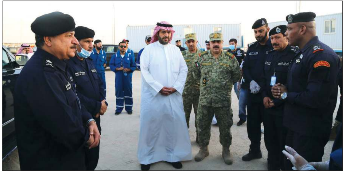
الوزير أنس الصالح خلال تفقده مركز إيواء المخالفين في كبد ويبدو الفريق عصام النهام والفريق ركن هاشم الرفاعي واللواء جمال الصالح