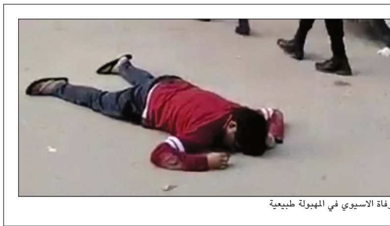
وفاة الأسبوي في المهولة طبيعية

أكد مصدر أمني مطلع أن وفاة وافد أسبوي مقابل أحد مراكز التسوق في المهولة هي وفاة طبيعية وليست لأسباب أخرى. وقال المصدر إن الأجهزة الطبية أكدت أن وفاة الأسبوي في قطعة 2 طبيعية، ولا صحة لما تم تداوله بوسائل التواصل.