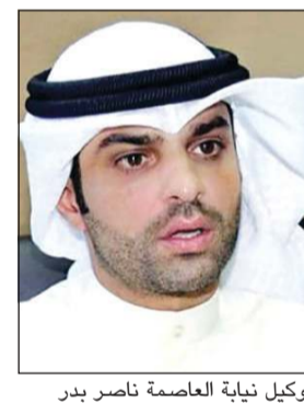
وكيل نيابة العاصمة ناصر بدر

يرجع إلى عدم قيام وزارة التربية بصرف مبالغ العقد له، رغم أن هؤلاء لا يعملون في وزارة التربية بالأصل. وذكر مصدر لـ «الأنباء»