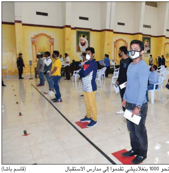
تعد 1000 بنغلاديشي تدموا إلى مدارس الاستقبال (قاسم باشا)

من اليوم الأحد في مدارس الفروانية والجليب. ورداً على سؤال عن موقف البنغاليين المخالفين في المناطق المفروض عليها حظر مناطقي اللواء عابدين: تم توفير باصات عند نقاط خروج محدودة في المنطقتين وتلك الباصات تقوم بتوصيل المخالفين الراغبين في الاستفادة من المهلة. وأشار إلى أن وزارة الداخلية تقوم بالفصل بين الجنسين في مدارس الإيواء، مرجحاً أن تنطلق رحلات سفر المخالفين التي بلدانهم خلال الأيام القليلة المقبلة عقب التنسيق في هذا الأمر مع بلدان المخالفين.