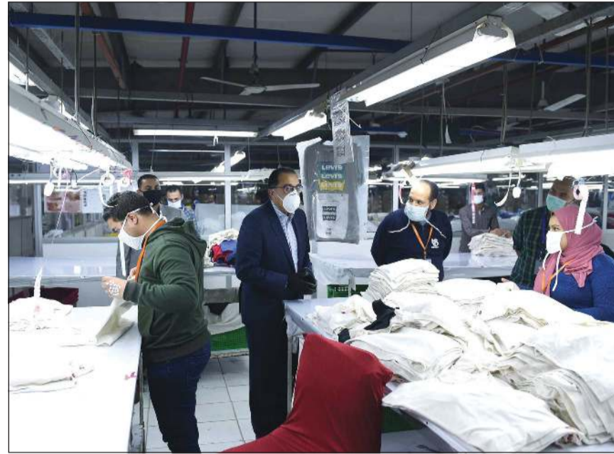
رئيس الوزراء مصطفى مدبولي يتفقد مصنعين بالمنطقة الحرة العامة بمدينة الإسماعيلية

لكل المواطنين على أن الدولة يجب أن تستمر في العمل بأقصى قدراتها، وضرورة قيام أصحاب الأعمال باتخاذ الإجراءات الاحترازية المطلوبة للحفاظ على صحة وسلامة العاملين، واستمرار عجلة نمو الاقتصاد المصري بما يضمن استقرار واستدامة النمو في مصر. وأشار رئيس الوزراء إلى أنه أكد مع أصحاب الأعمال خلال لقائه معهم على ضرورة حماية العرضة للإصابة، سواء ذات الفئات العمرية الكبيرة أو ذات ظروف صحية معينة، وذلك من خلال التخفيف عنهم أو حصولهم على إجازات مدفوعة الأجر، مؤكدا ضرورة عدم تأثر حجم الأعمال واستمرارها، قائلا في هذا الصدد: «استمرار المسارين معا بنفس القوة،