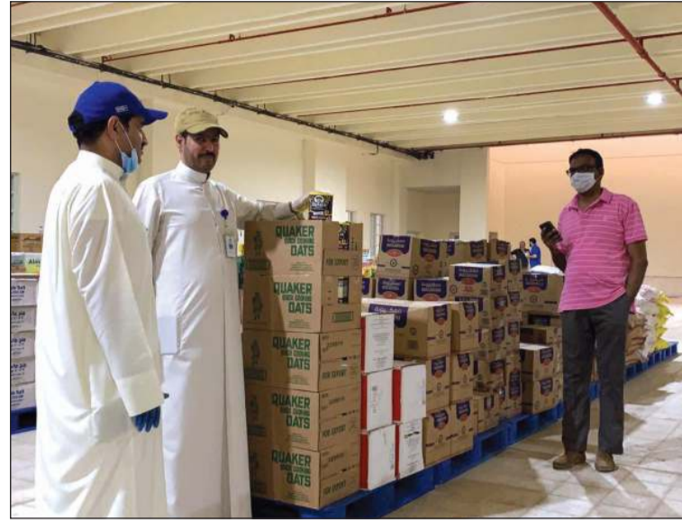
الفرع الميداني الجديد بمنطقة المهبولة