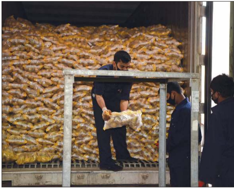
البطاطا والخضراوات متوافرة في السوق

كبيرة جداً وإدارة وتنظيم السوق من قبل شركة «الوافر»، وكذلك شهدت إشراف موظفي وزارة التجارة على عمليات تسليم البصل المندوبي للجمعيات التعاونية والأسواق المركزية ومنافذ بيع الخضار والفاكهة في البلاد. وأشار المصدر إلى أنه بعد إغلاق الفضة أمام المتسوقين تفرغنا للجمعيات والبقالات ومنافذ بيع الخضار، ولا يوجد أي نقص توريد في أي من السلع الأخرى، حتى الطماطم متوافرة من الأردن والكويت ومصر، وتطمئن عموم المواطنين والمقيمين بأن الفضة كانت زالت صمام أمان للأمن الغذائي في الكويت، والجهاز التشغيلي والعمليات متواجدة على مدار الساعة.