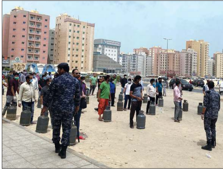
«الدفاع المدني» والقوات الخاصة قاموا بتنظيم طوابير الغاز بشكل مغاير لما كان في الأيام السابقة