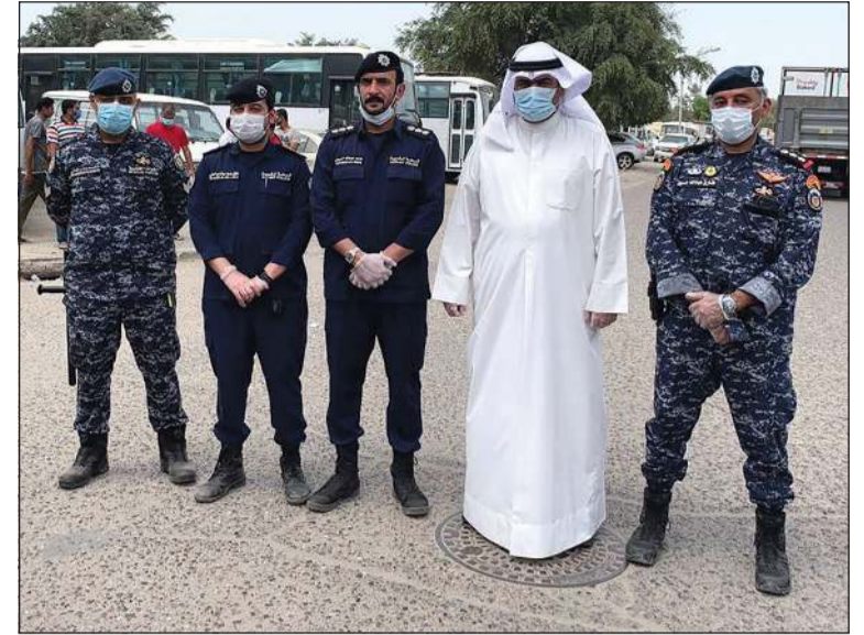
دخال الروضان مع عدد من رجال «الداخلية» والقوات الخاصة خلال الجولة

وزير التجارة أثنى على سرعة استحداثه بمنطقة معزولة تماماً