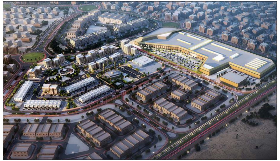
مشروع تطوير '3' ضمن تطوير مدينة جابر الأحمد