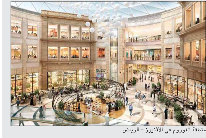
منطقة الفوروم في الأقنيوز - الرياض

المؤشرات المالية وحققت شركة المباني خلال السنة المالية 2019، أرباحاً صافية بلغت 56,41 مليون دينار، بربحية للسهم الواحد 54,24 فلساً، مقارنة بنحو 52,53 مليون دينار في 2018، وربحية للسهم الواحد قدرها 50,57 فلساً. وبلغ إجمالي حقوق المساهمين 473 مليون دينار مع نهاية ديسمبر 2019، بارتفاع نسبته 11,25٪ عن الفترة نفسها من 2018، في حين بلغت قيمة الموجودات 965 مليون دينار، بارتفاع نسبته 11,9٪ عن المستوى الذي وصلت إليه مع نهاية ديسمبر 2018. وشهد الشايح على أن عام 2019، شهد