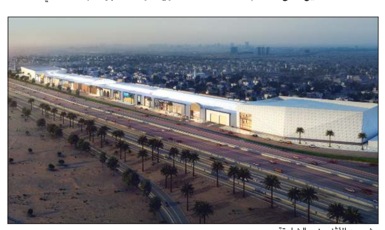
مشروع الأقنيوز - الشارقة