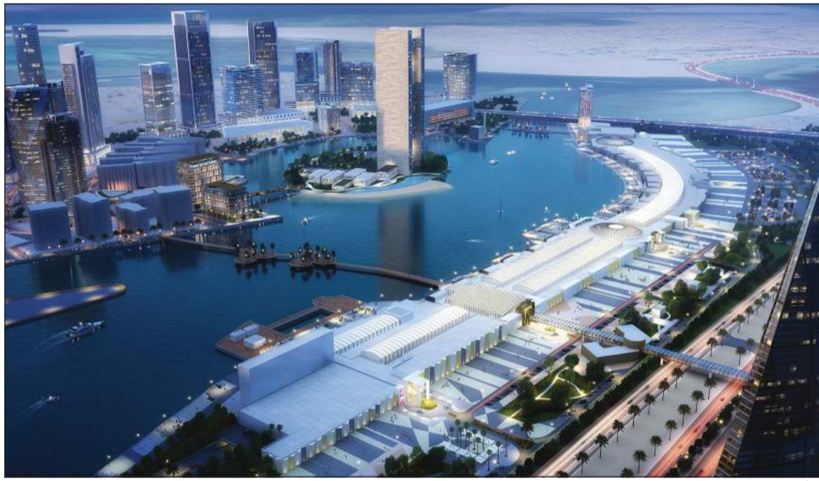
الأقنيوز - البحرين