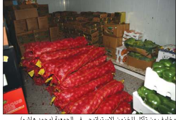
مخاوف من تآكل المخزون الاستراتيجي في الجمعية (محمد هاشم)