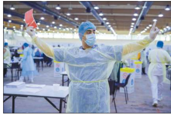
جهود مشرفة تبذلها الطواقم الطبية

وتتيح قوائم إعداد الطعام التلقائية لبرنامج «القلي بالهواء الصحي» الاستمتاع بأشهى الأطعمة مثل البطاطا المقلية والدجاج المقرمش من دون الحاجة لاستعمال زيت القلي، حيث نجحت «باناسونيك»، وبفضل تقنيات أحدث ابتكاراتها المتطورة بمجال التسخين، في إلغاء الحاجة لطرق القلي التقليدية بالزيت، مع ضمان هذه الفلسفة من «باناسونيك» إلى العنصر الغذائي والقيمة. كما يتمتع الميكروويف الجديد NN-CD87 بمزايا إضافية أخرى تشمل مستشعر Genius الذي يراقب مستويات البخار ودرجة الحرارة الداخلية ويحدد وقت التسخين المناسب لتحقيق أفضل نتائج الطهي. ويمتاز الميكروويف الجديد أيضاً بزر «إعادة التسخين بضغط واحدة»، الذي يضمن احتساب الوقت اللازم لإعادة تسخين الطعام بدقة لمنع الإفراط في طهي الأطعمة أو عدم اكتمال نضجها. ما يوفر وسيلة مبسطة وفعالة تلغي حاجة المستخدمين لضبط الوقت بعد تحديد وزن الطعام. ويفضل المزايا المتطورة التي تساعد في تحضير وجبات