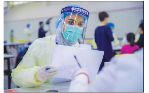
شكراً خط الدفاع الأول