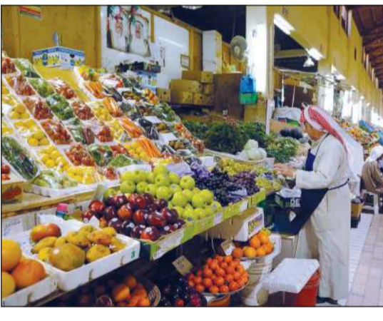
الكويت بنسبة 0,9٪، علما أنه كان يسجل 115,3 نقطة

في يناير 2020، وبحساب التضخم، باستثناء الأغذية والمشروبات، فقد ارتفع 1,39٪، أما عند احتسابه باستثناء مجموعة خدمات المسكن فقد صعد 2,94٪. ويعد الرقم القياسي لأسعار المستهلك أداة لقياس مستويات الأسعار عموما بين فترتين إما شهرية أو سنوية وعادة ما يكون مؤشرا أساسا لقياس النمو أو الانكماش الاقتصادي، إذ يمكن للدول من خلاله اتخاذ القرارات الاقتصادية والتجارية ورسم السياسات النقدية والمالية.