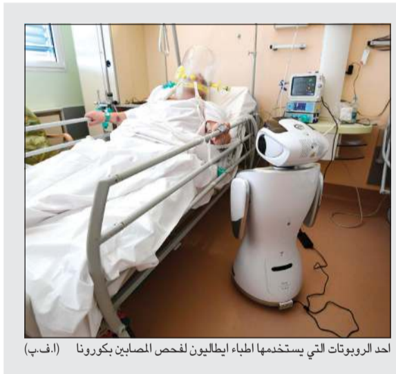
أحد الروبوتات التي يستخدمها أطباء الطليون لفحص المصابين بكورونا (أ.ف.ب)

نقل موقع روسيا اليوم. من جهتها، أعلنت وزارة الصحة البريطانية أمس ارتفاع عدد الوفيات التي تسجلت 708 حالات وفاة جديدة خلال 24 ساعة. وأكدت وزارة الصحة في بيان صحفي أنها سجلت 3735 إصابة جديدة بالعدوى الأمر الذي رفع إجمالي الإصابات إلى 41,903. بدورها، أعلنت سويسرا أمس ارتفاع عدد المصابين إلى 20278 والوفيات 540 حالة وفاة. وأضافت وزارة الصحة