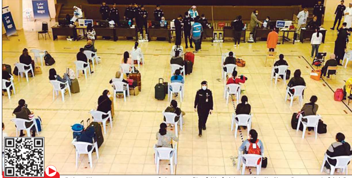
.. «الداخلية»، قدمت جميع التسهيلات للمخالفين من إعاشة وإقامة وتذاكر سفر مجانية (قاسم باشا)