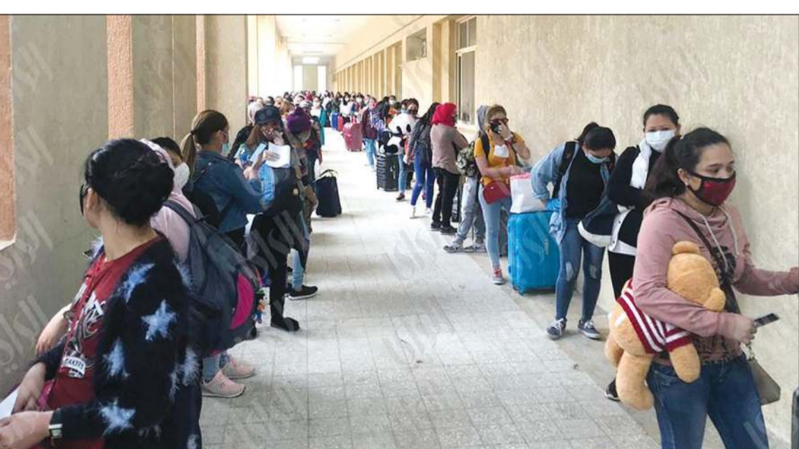
الوافدون الفلبينيات اصطفوا للاستفادة من المهلة