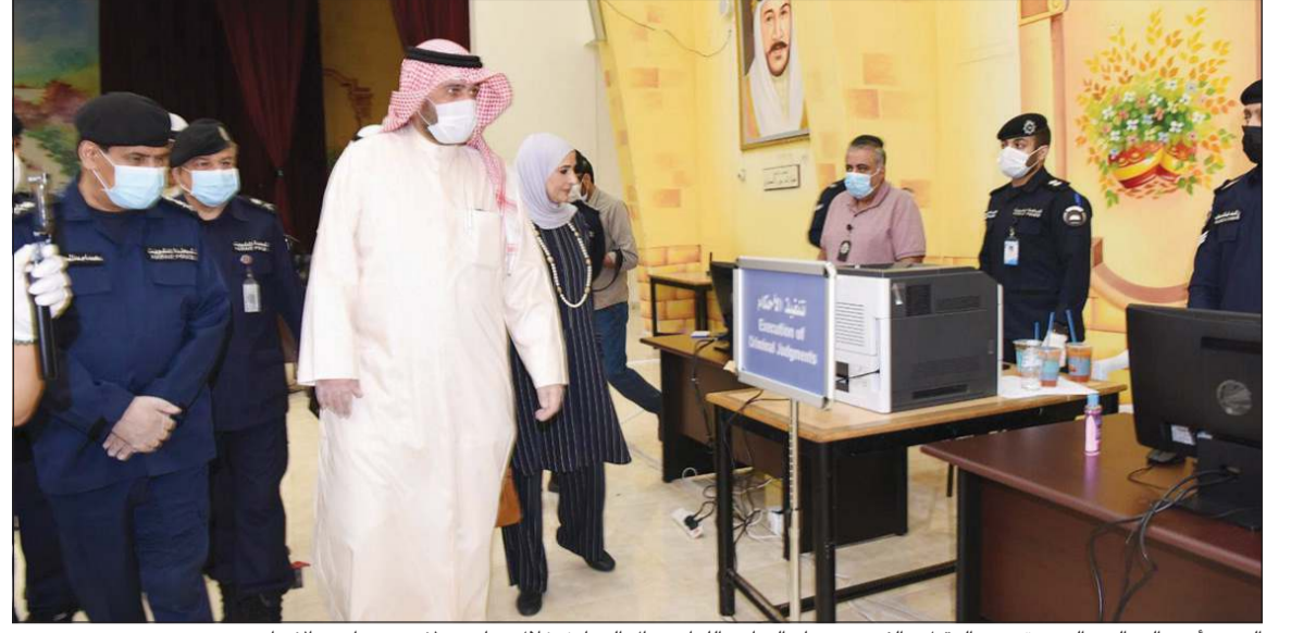
الوزير أنس الصالح والوزيرة مريم العجيل والفريق عصام النهام واللواء جمال الصايغ خلال زيارتهم لاحدى مدارس الإيواء