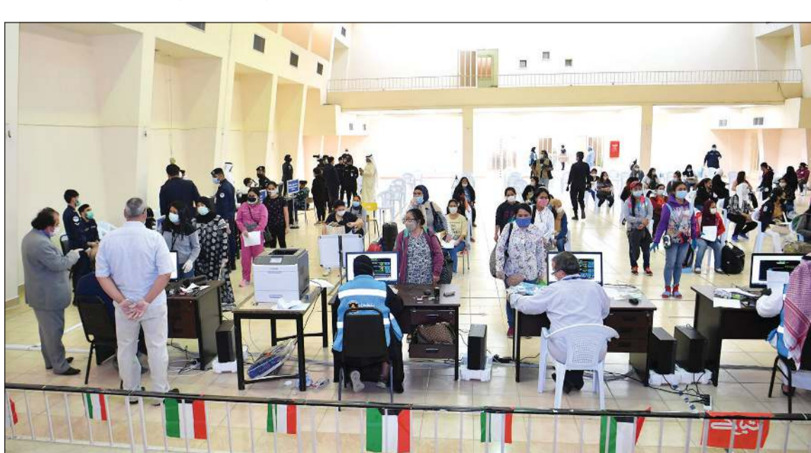
استقبال المخالفين من الجنسيات الفلبينية ممتد حتى الأحد المقبل