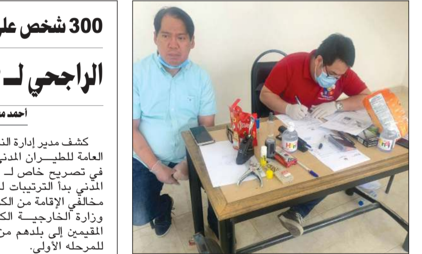
ممثلان عن السفارة الفلبينية لإنجاز المعاملات