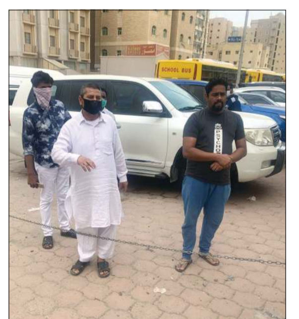
وافدون من جنسيات مختلفة تردوا على مدارس الإيواء