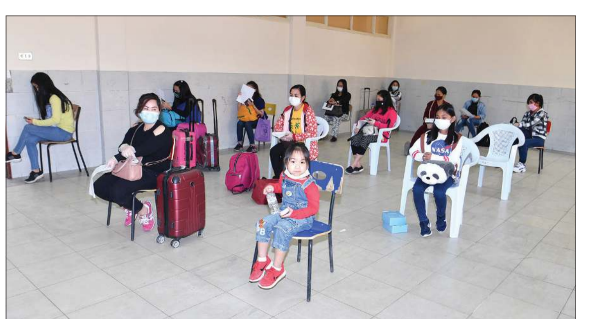
اطفال حضروا برفقة ذويهم للسفر على حساب دولة الكويت