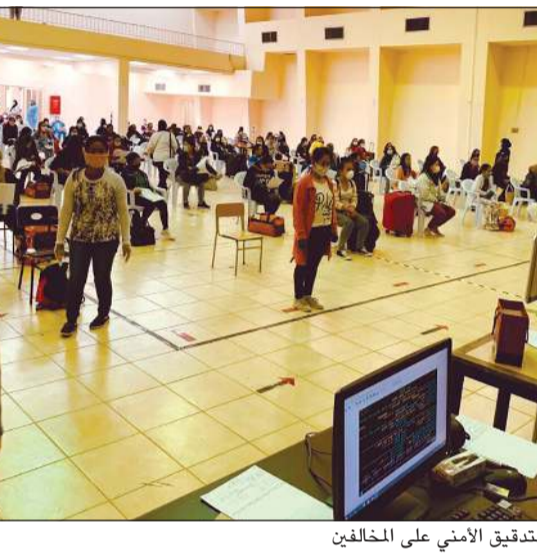
التدقيق الأمني على المخالفين

وذكرت الإدارة العامة للعلاقات العامة أنه تم تجهيز مقر لإيواء المخالفين حتى تاريخ سفرهم مع توفير كل سبل الحياة الكريمة من وجبات ومشروبات مجانية وتجهيزات طبية، موضحة أنه تم وضع جدول زمني محدد لاستقبال الجاليات المغادرة وفق ما يلي: الجالية الفلبينية (1