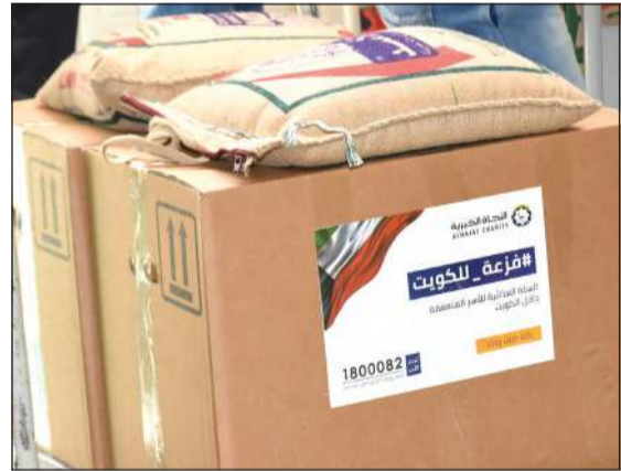
نوصل المساعدات بدأ بيد