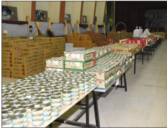
تهدف إلى تغطية كل مناطق الكويت

بالكويت. وتابع الهولي: تضم السلال الغذائية المواد الضرورية التي تحتاج إليها الأسر (كالأرز والسكر والتمر والمعكرونة ومعجون الطماطم والزيت والمعلبات، وغيرها من العدس) وغيرها من الاحتياجات الأخرى، وتكفي هذه السلة الأسرة لمدة شهر تقريبا، ونحرص على مراعاة خصوصية وكرامة الأسر المستفيدة، ونوصل