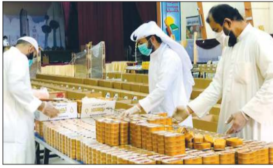
جهود خيرية من «النجاة الخيرية» لتنفيذ حملة «فرقة للكويت»