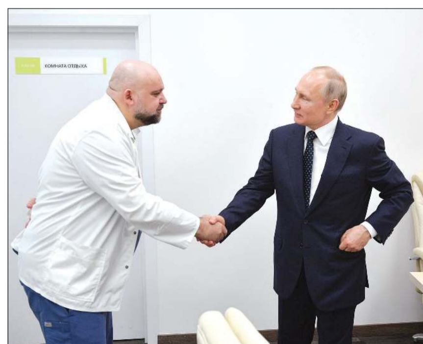
الرئيس الروسي فلاديمير بوتين مصافحاً الطبيب دينيس بروتسنيكر خلال زيارته للمستشفى

وبحسب آخر حصيلة رسمية، فإن روسيا باتت تسجل 2237 حالة إصابة مثبتة بفيروس كورونا المستجد و17 حالة وفاة بعدما تم إحصاء 500 إصابة و8 وفيات يوم أمس وحده، وهو رقم قياسي حتى الآن. وأحد هذه الإجراءات ينص على عقوبة تصل إلى السجن سبع سنوات لكل من يخنك الحجر بشكل يؤدي إلى وفاة شخصين على الأقل.